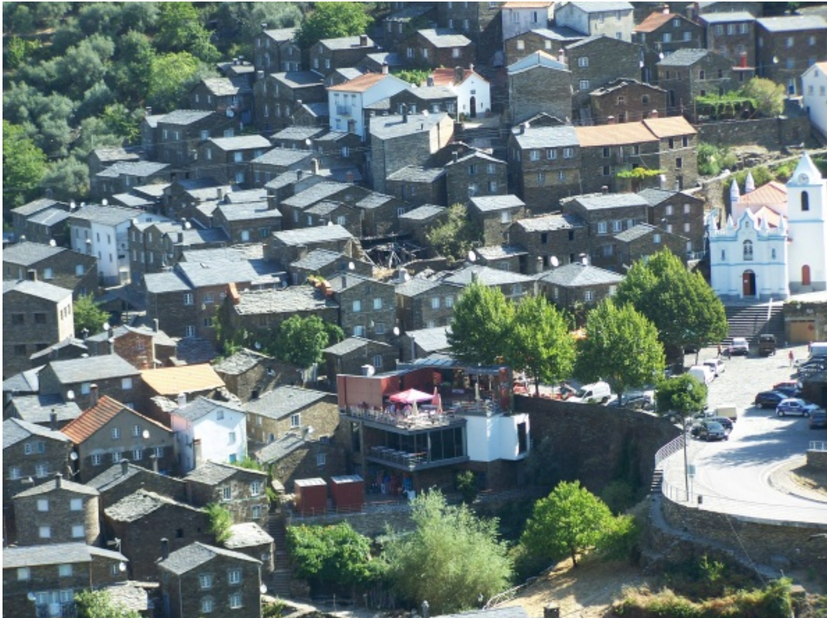
Vista da aldeia de Piódão