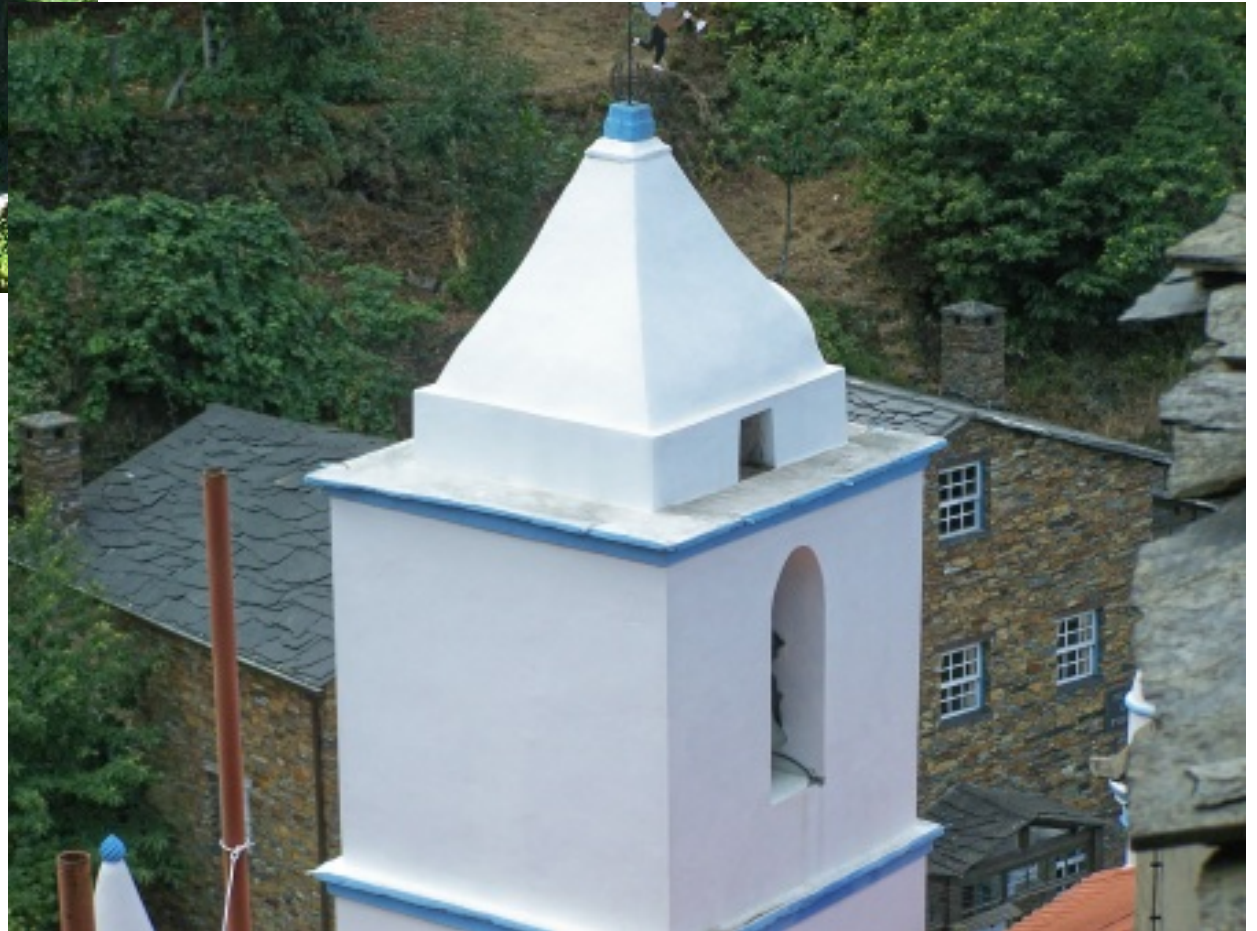
Pormenores de fonte e torre da Igreja