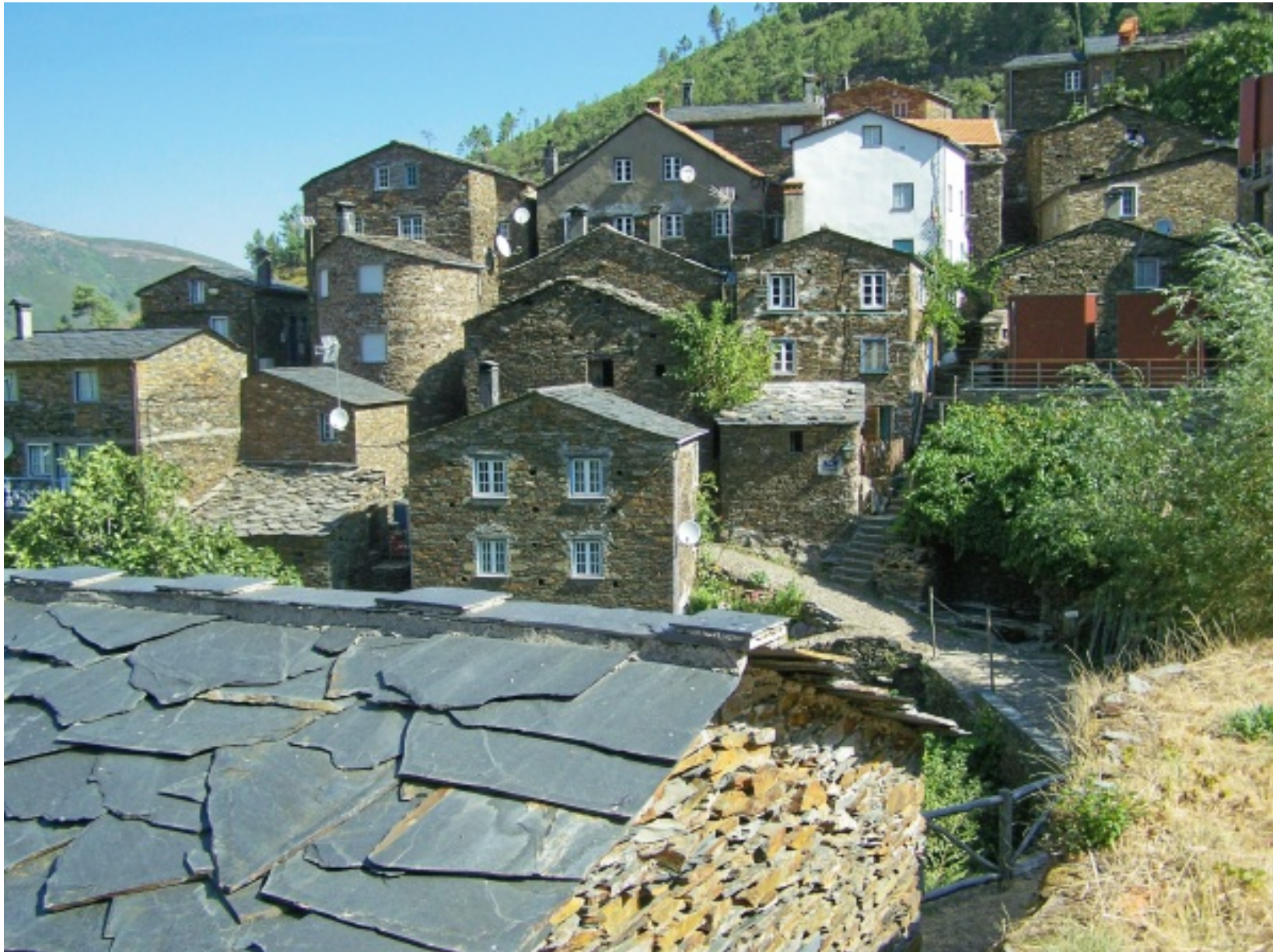
Pormenores do centro da aldeia