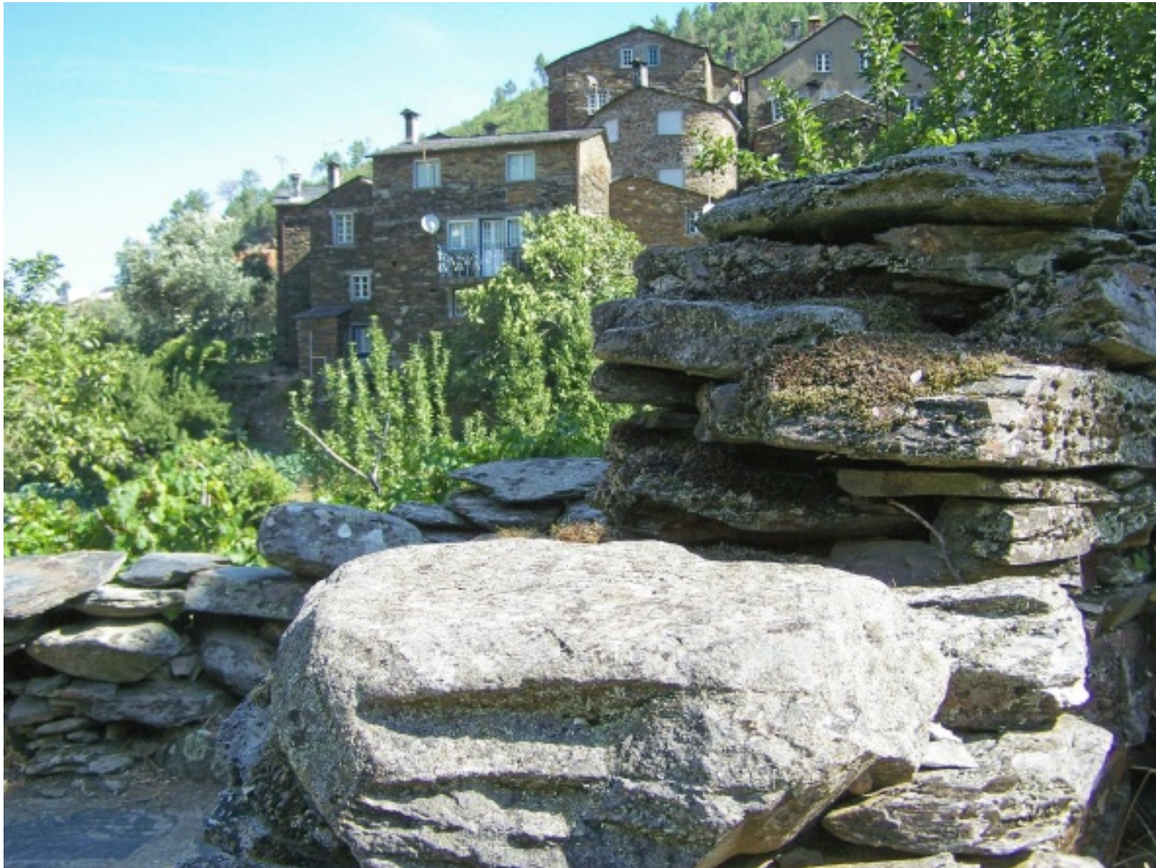
Pormenores do centro da aldeia