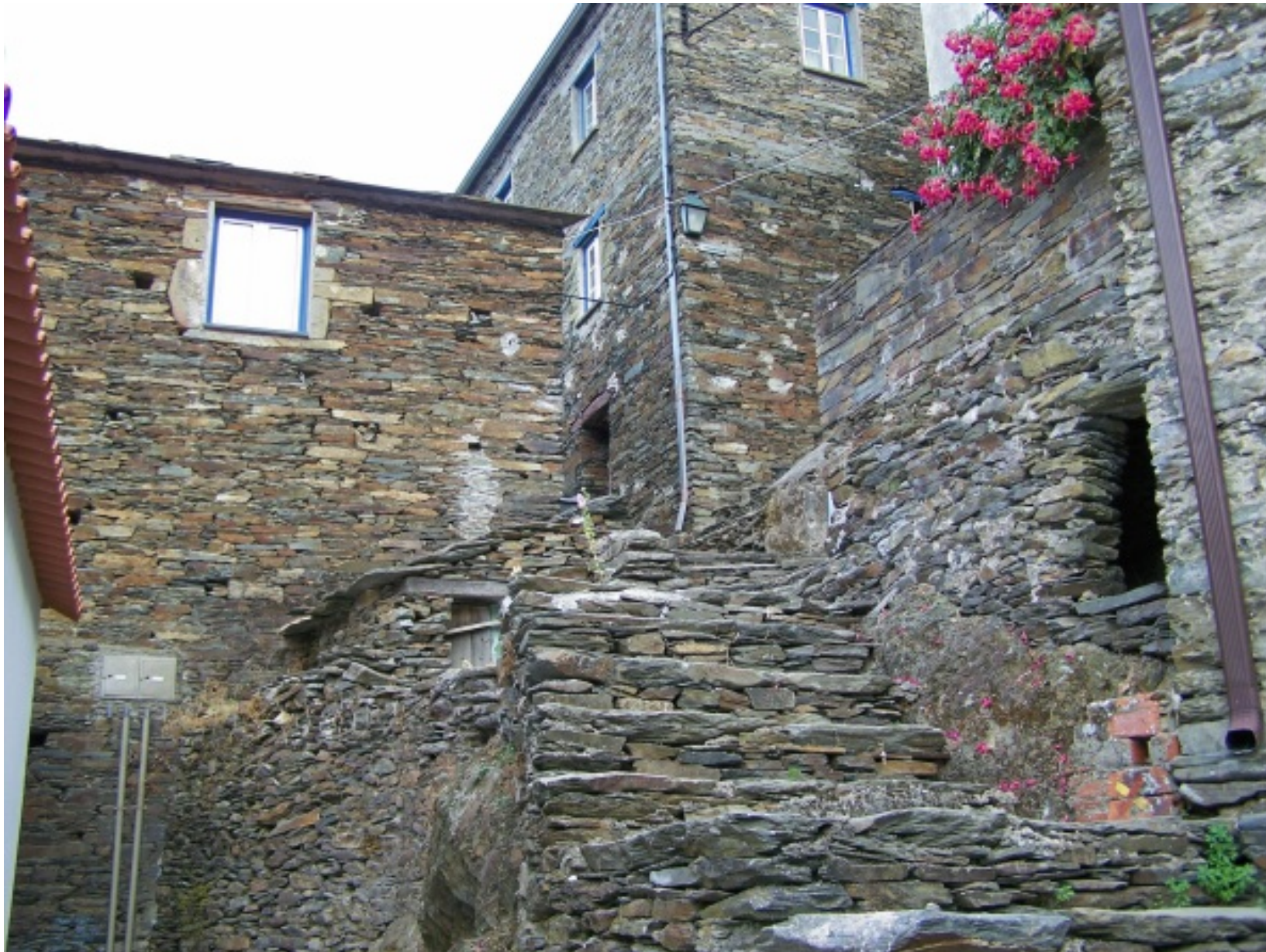
Aspecto de habitações