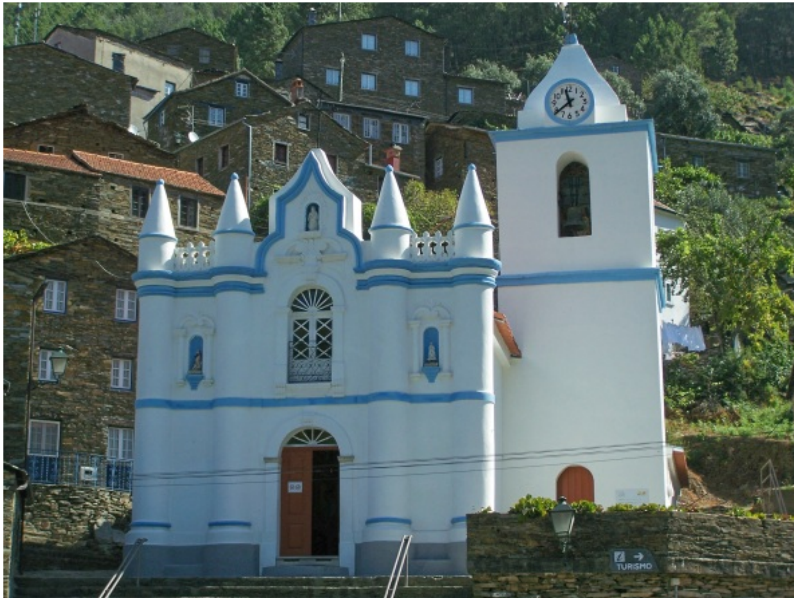
Fachada da Igreja Matriz