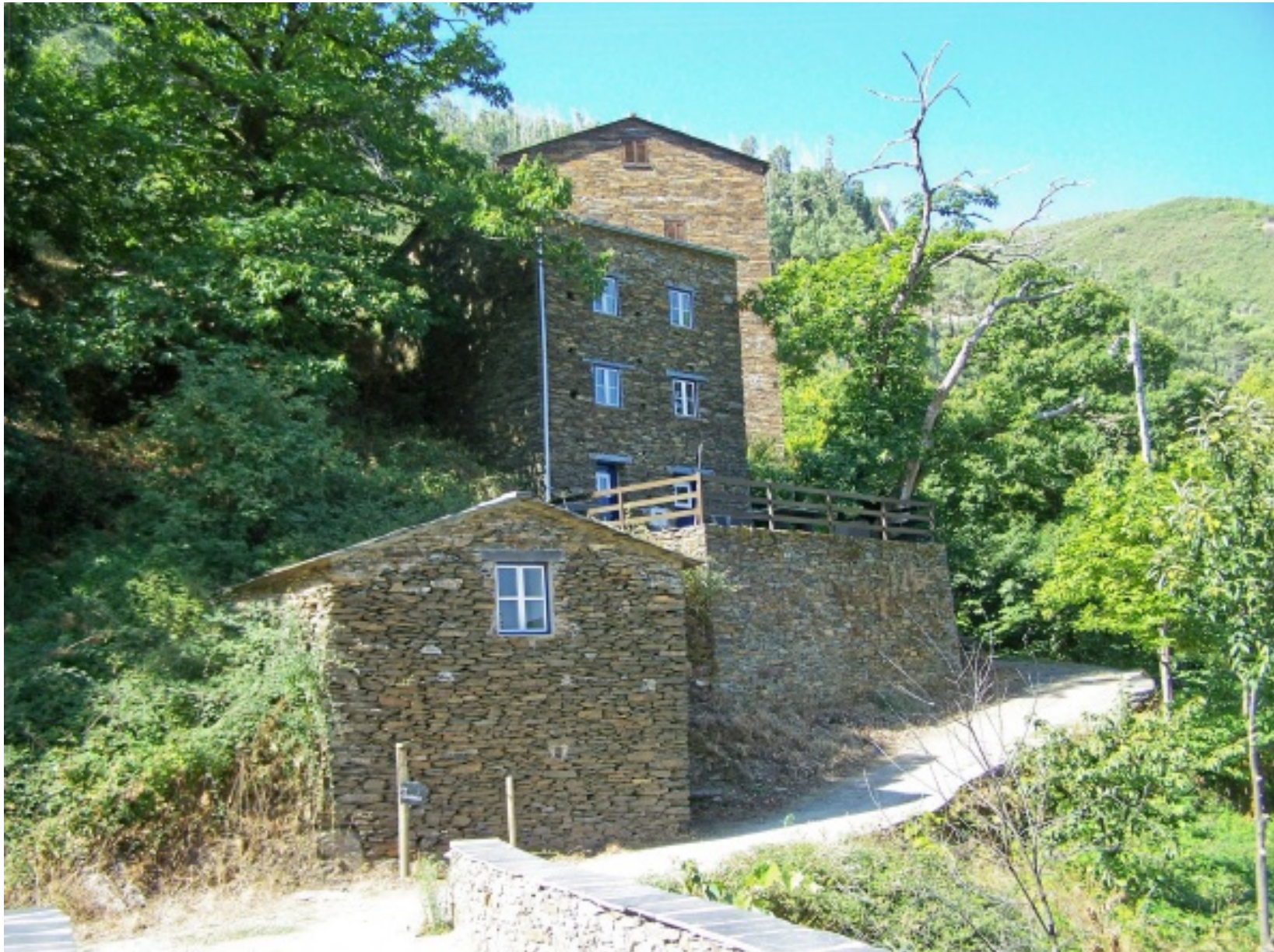
Casas em xisto, no centro de uma paisagem verdejante