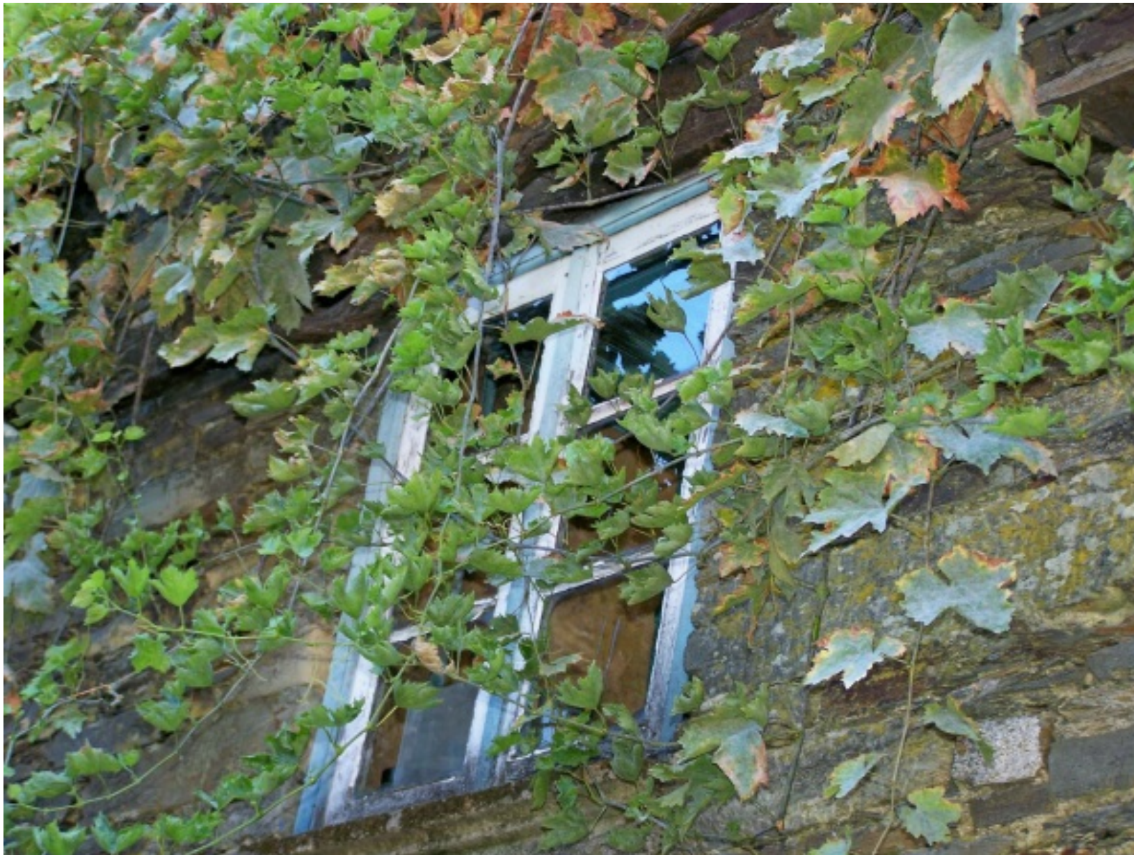
Pormenor de uma janela