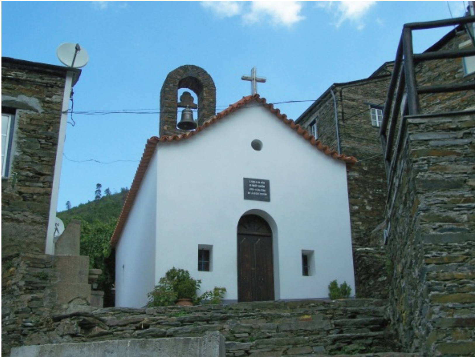
Capela de São Pedro do Bom Amigo, padroeiro do Piódão