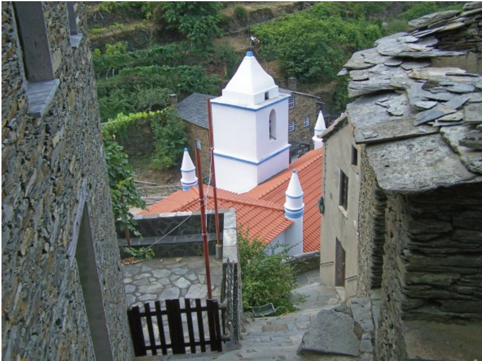
Perspectiva da Igreja Matriz