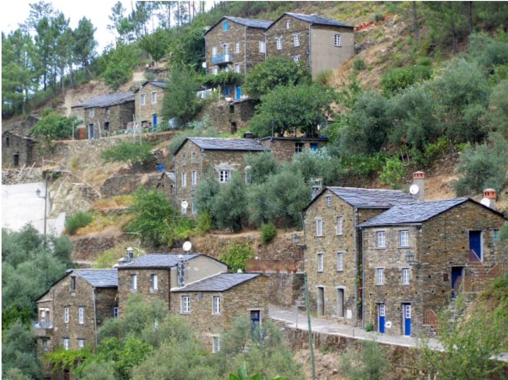
Aglomerado de habitações