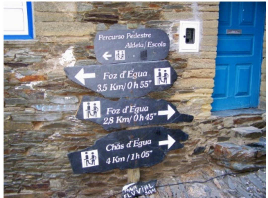
Exemplos de percursos pedestres