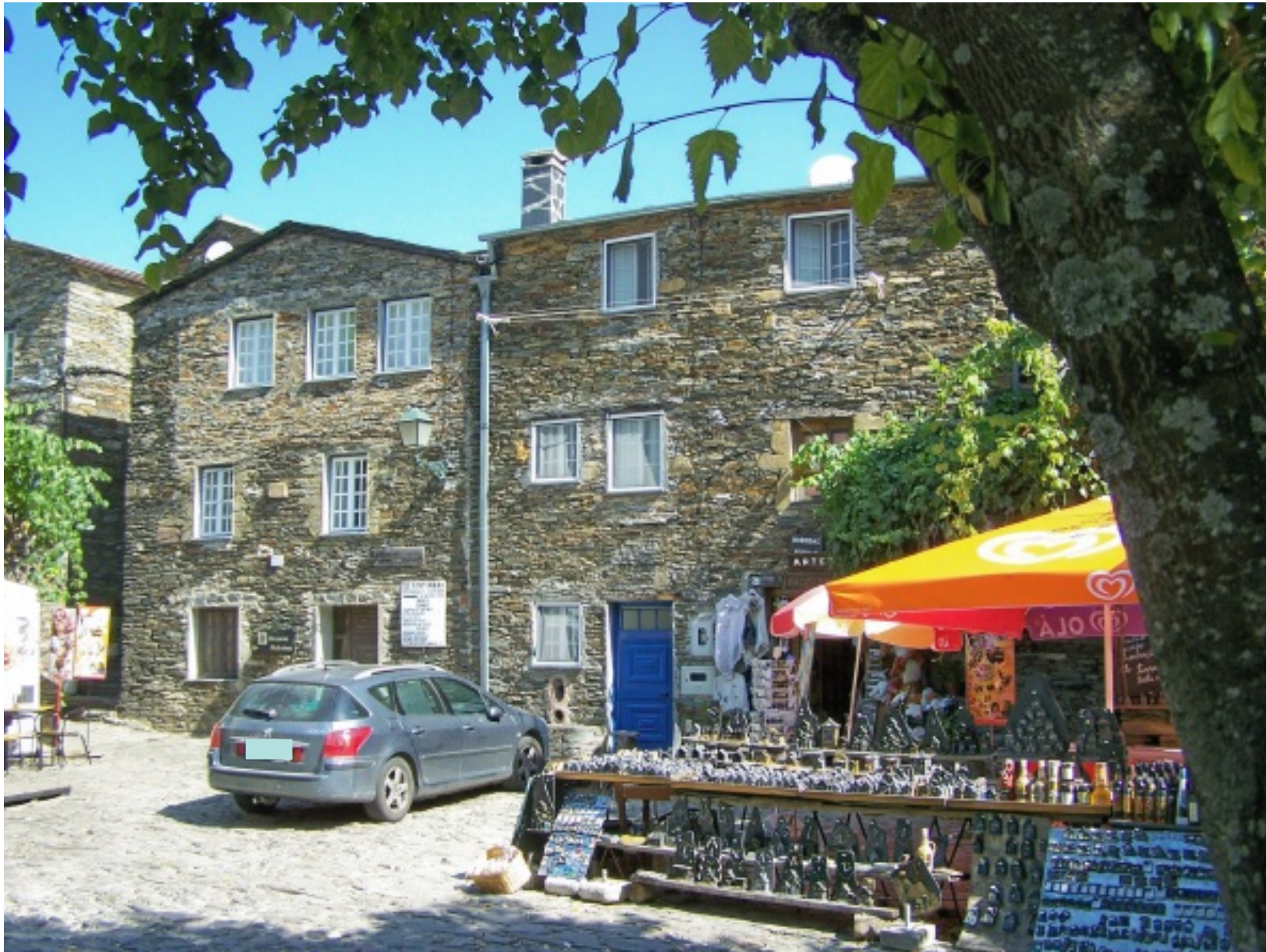
Praça Central da aldeia