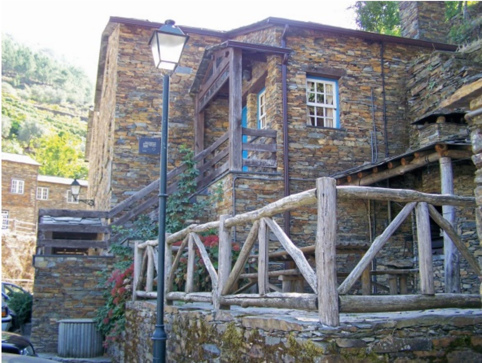
Museu do Piódão