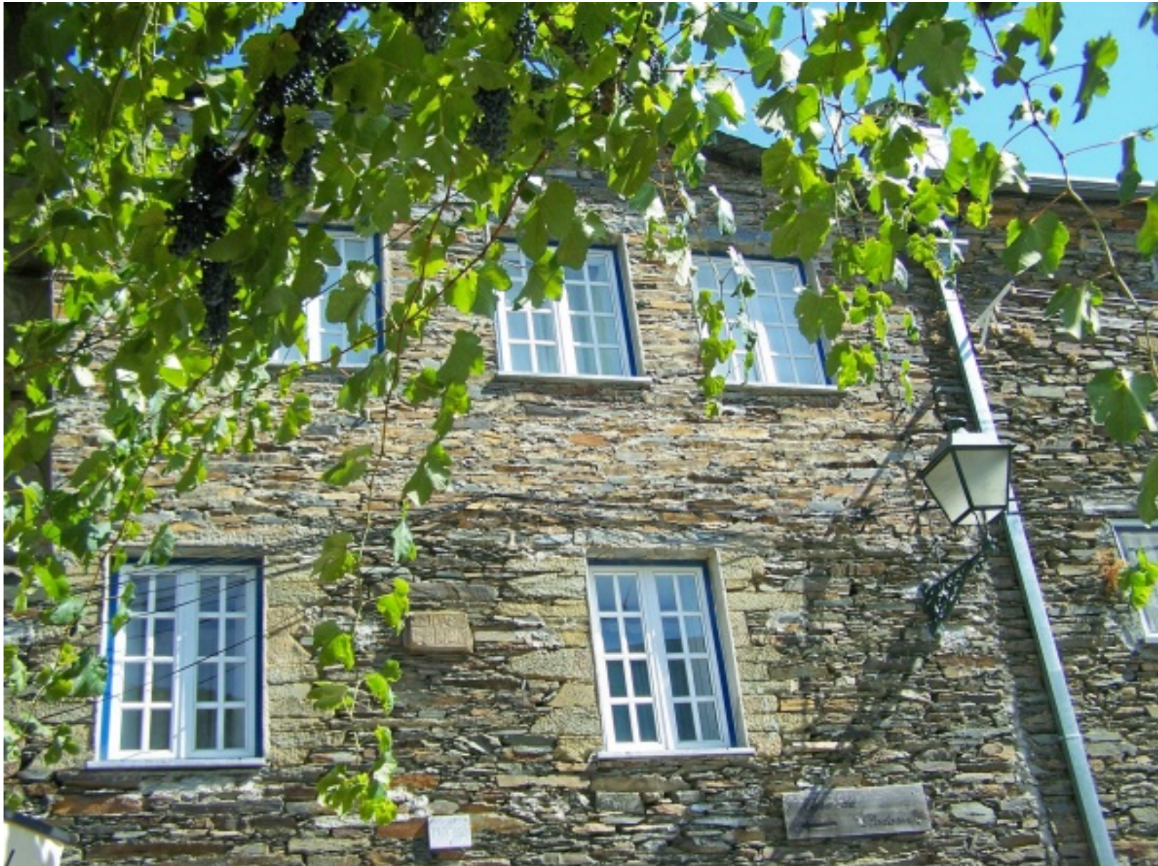
Exemplo de fachada