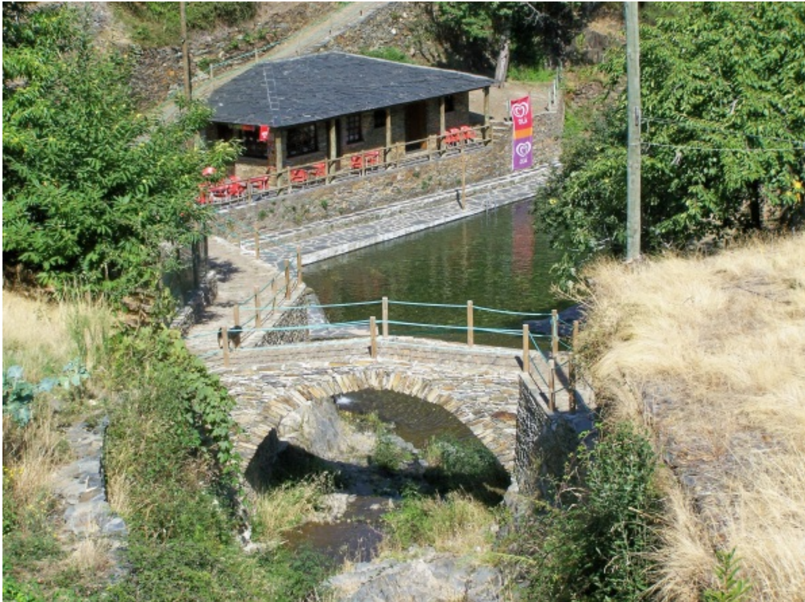
Vista da praia fluvial