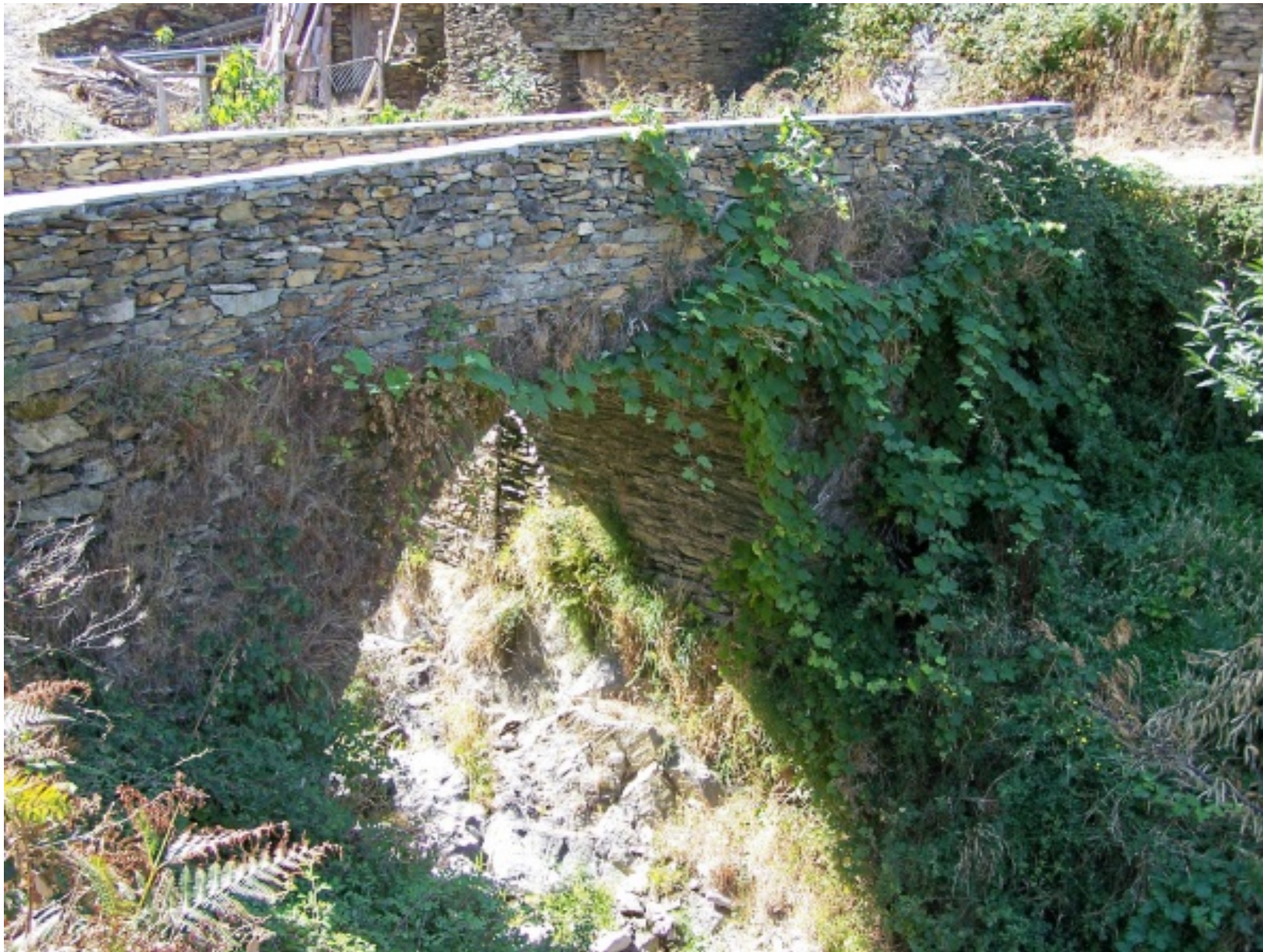
Ponte localizada na praia fluvial