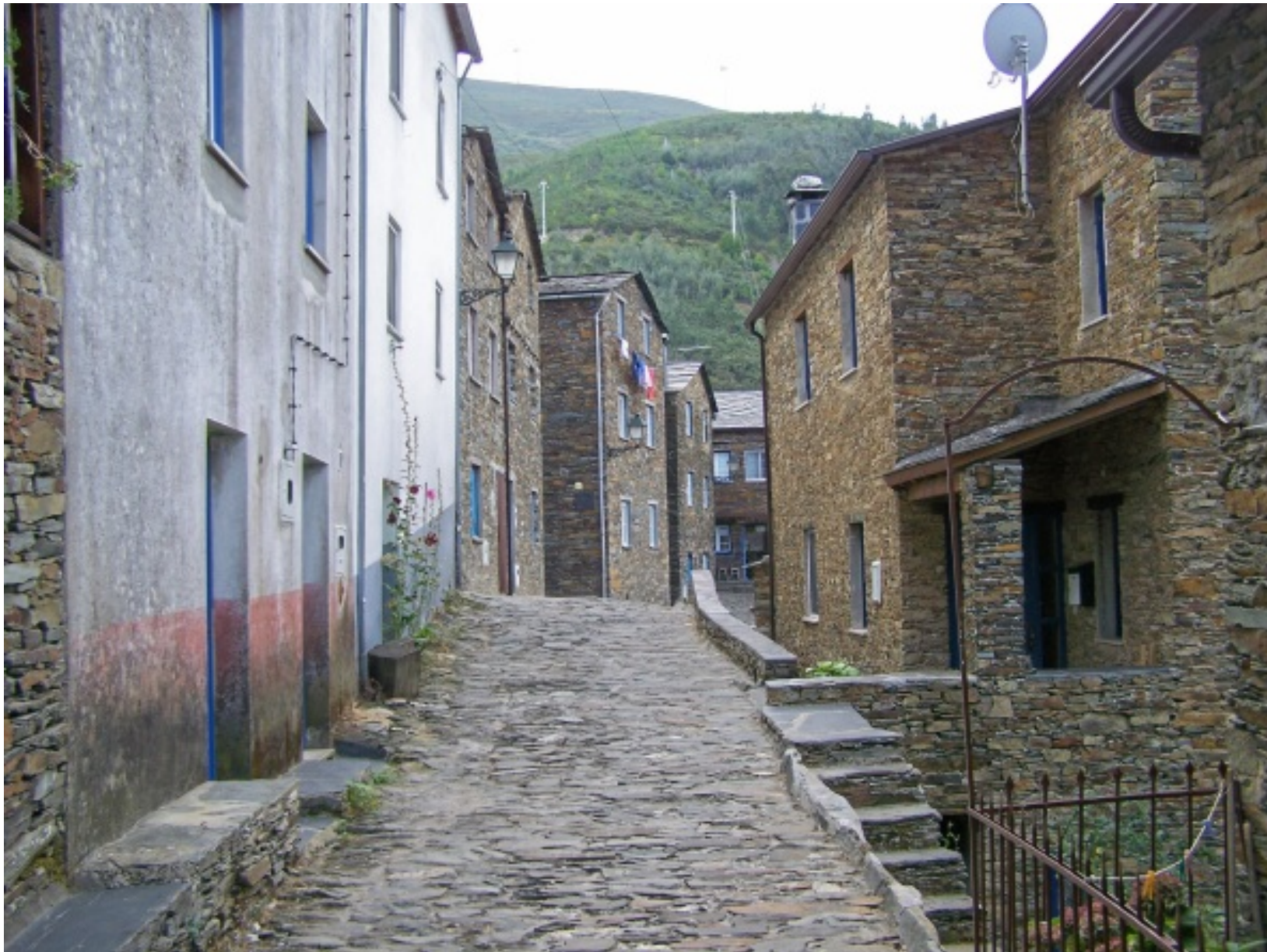
Um das muitas ruas da aldeia