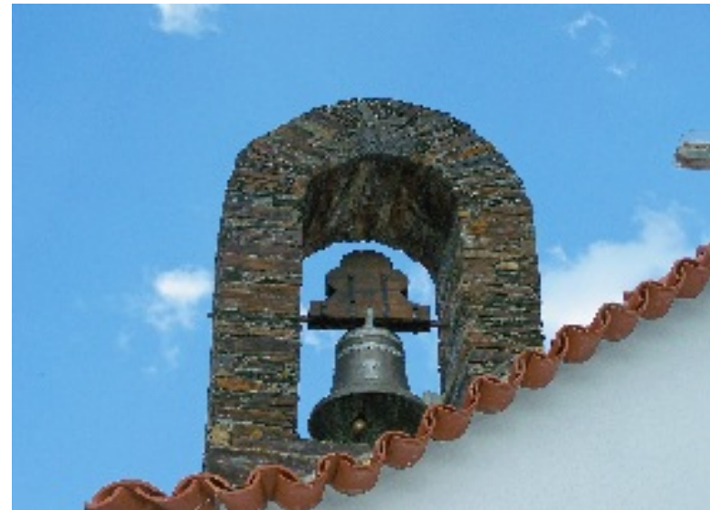
Pormenores arquitectónicos da aldeia