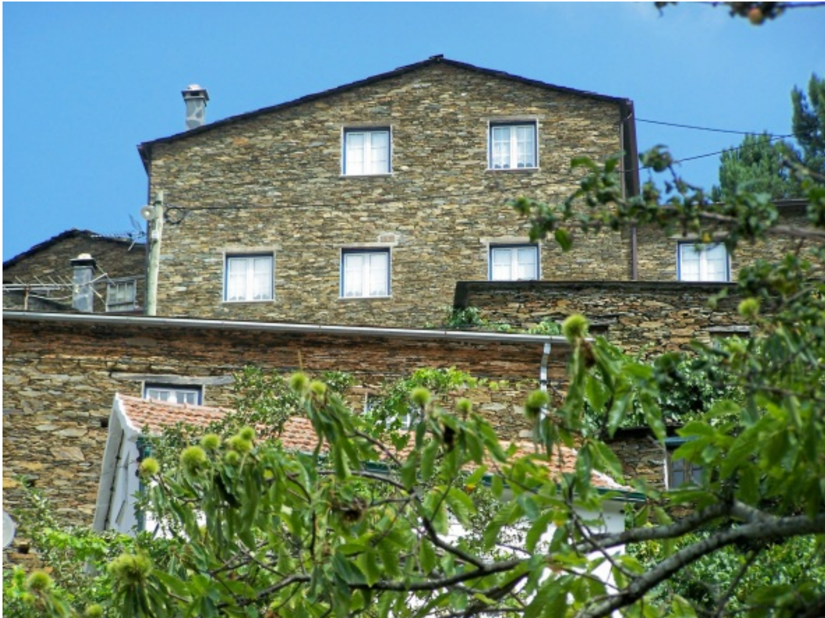
Pormenor do centro da aldeia