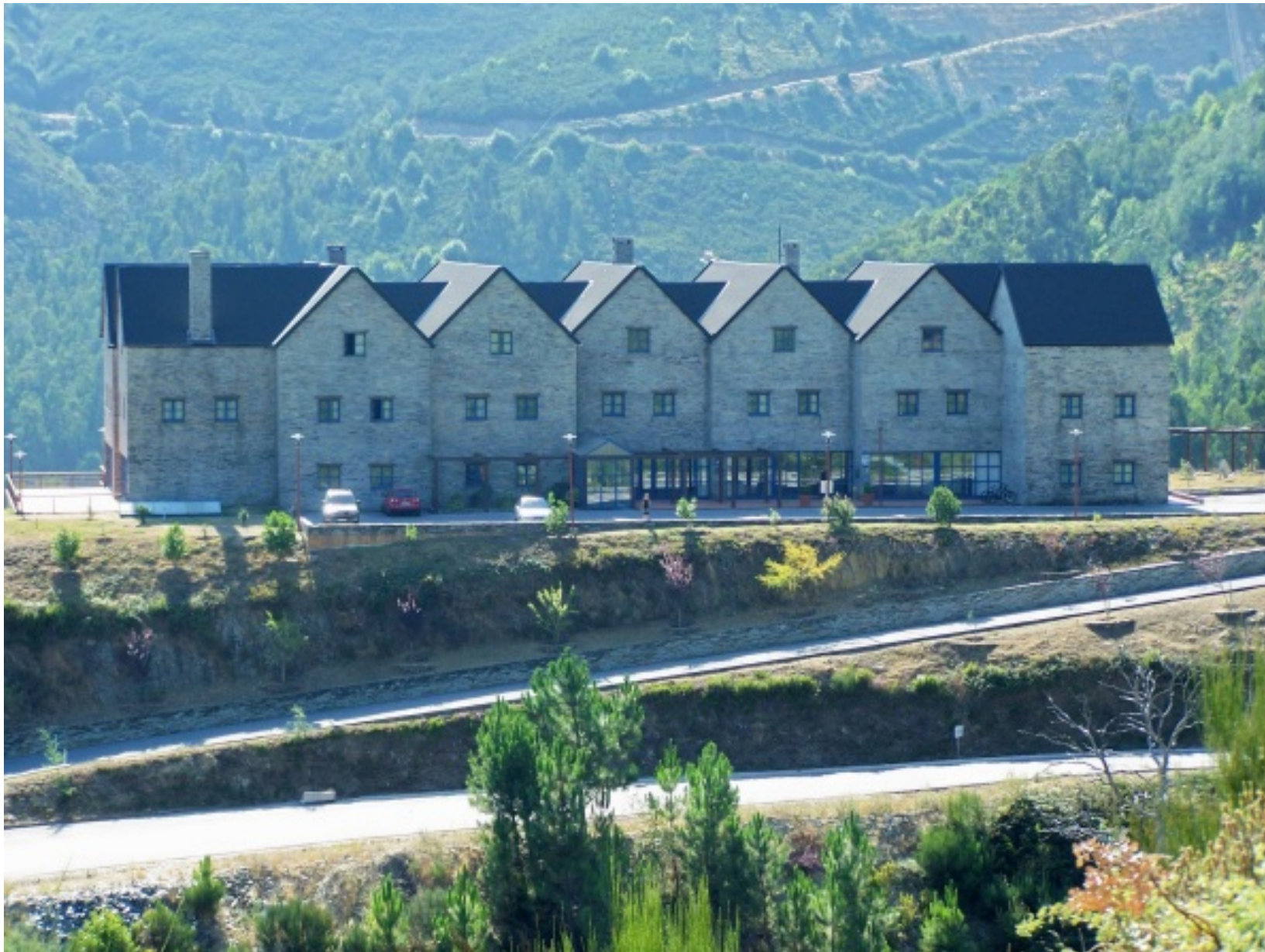
Estalagem do Piódão