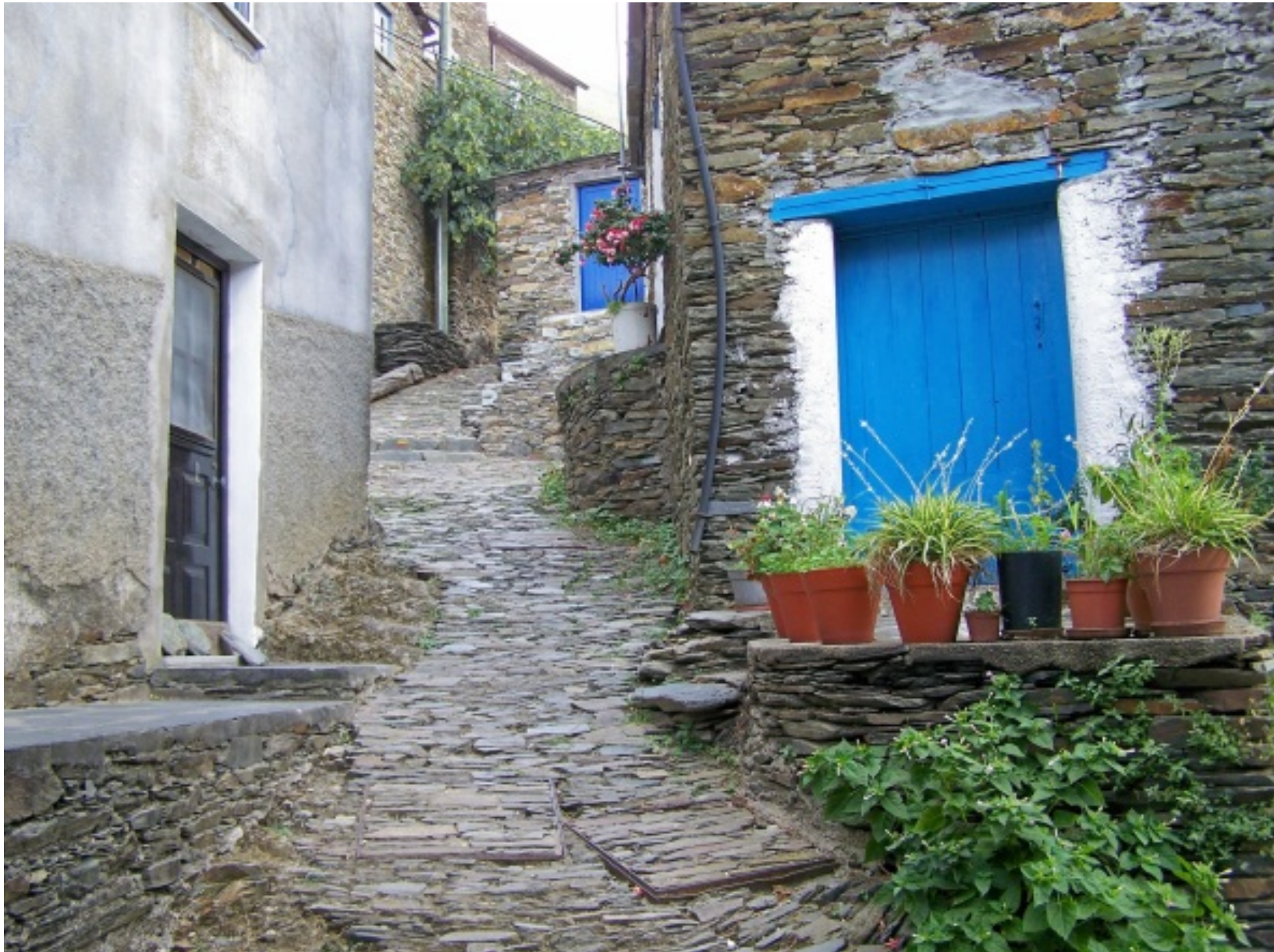
Rua típica da aldeia