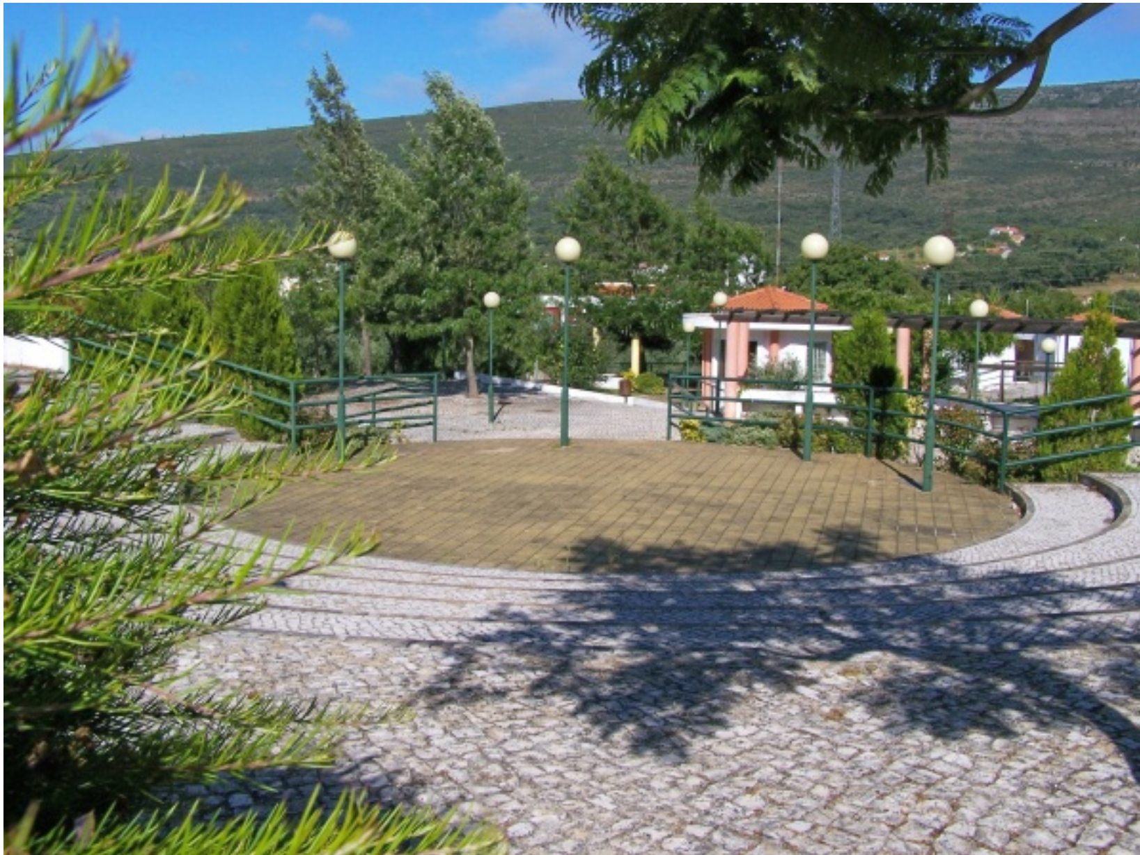
Vista do Jardim Municipal de Alvaiázere