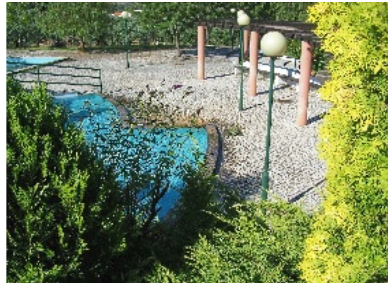
Aspectos do Jardim Municipal