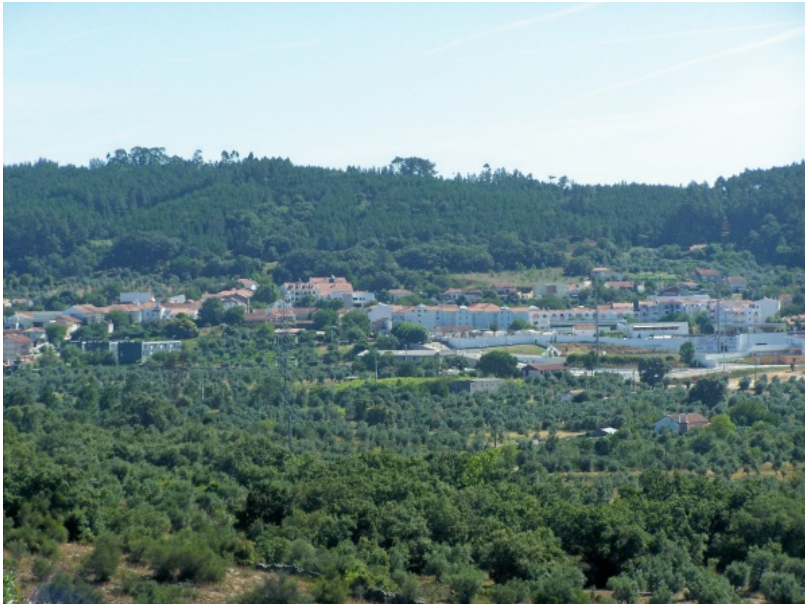
Vista parcial da vila de Alvaiázere