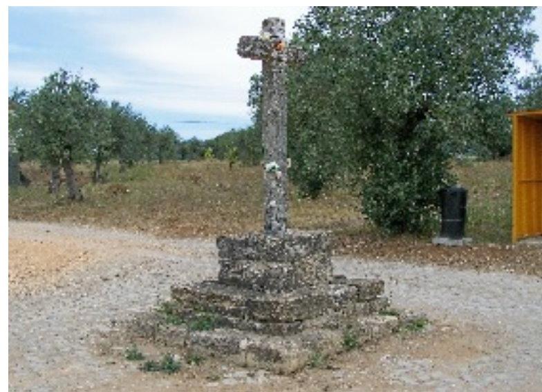
São Pedro do Rego da Murta: Pormenores da Igreja Matriz e Cruzeiro