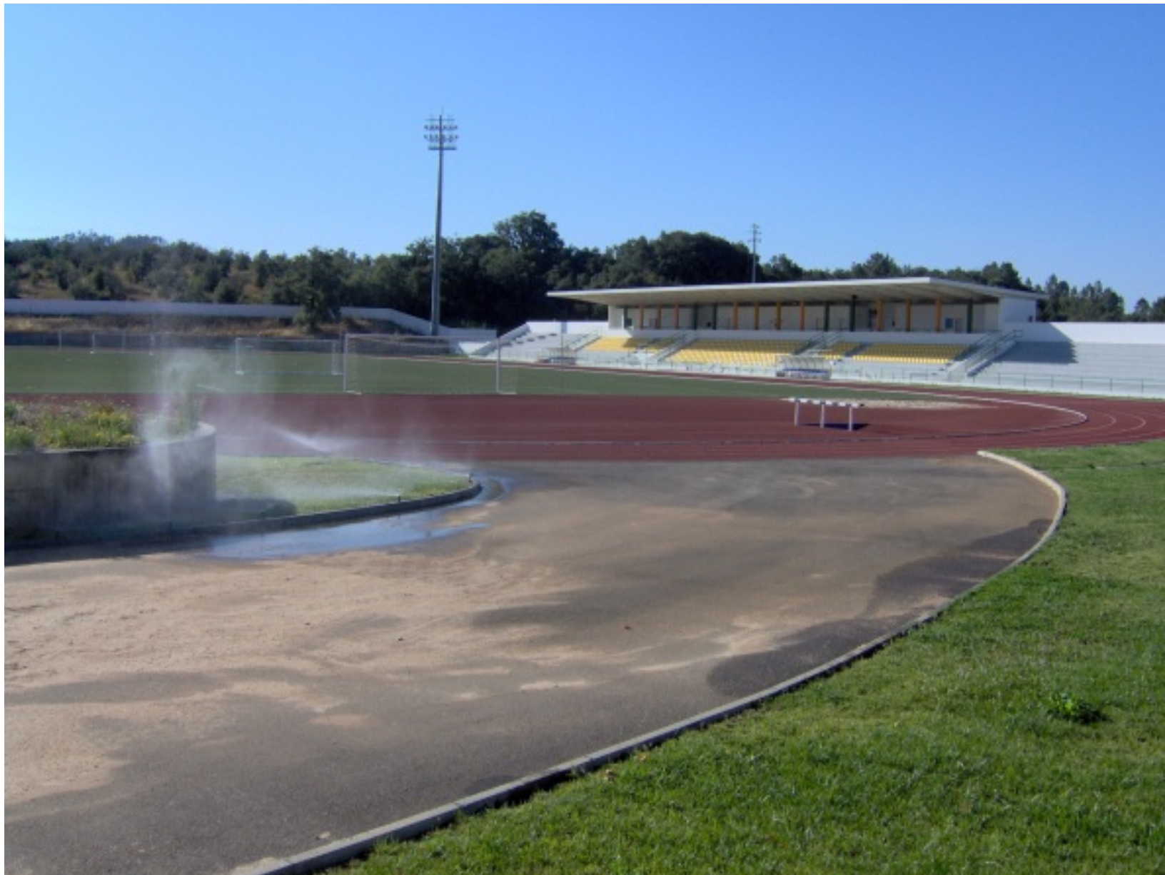
Estádio Municipal de Alvaiázere