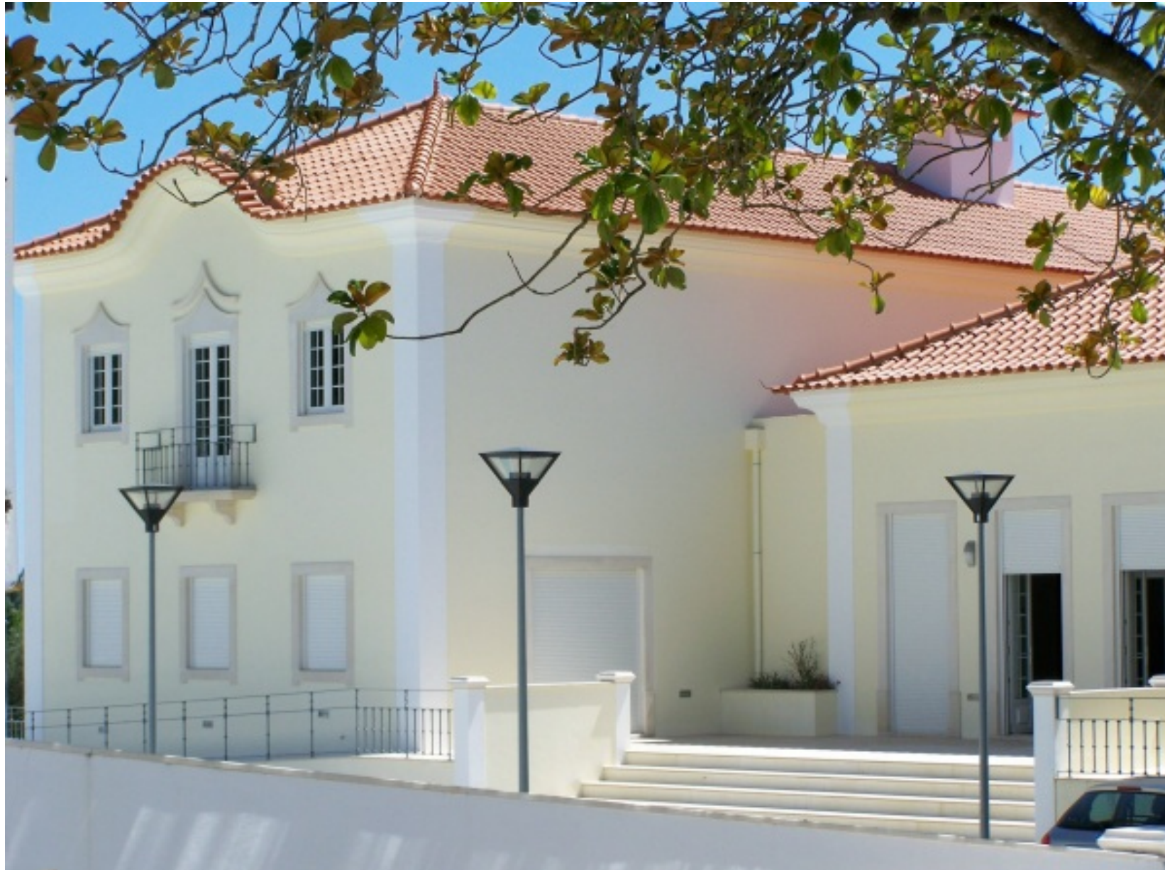
Fachada do Museu Municipal