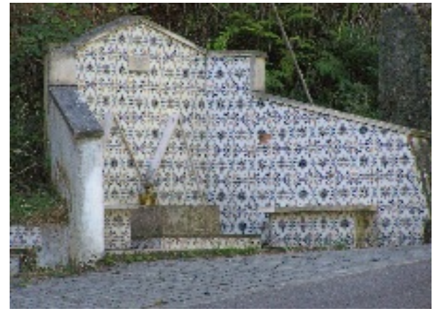
Afloramentos quartezíticos, Mata dos Carvalhos na localidade de Ariques e aspecto de mós antigas (em cima) Antigo forno de cal, cruzeiro Filipino em Maças de Dª Maria e fonte junto à praia fluvial de Ribeira D'Alge (em baixo)