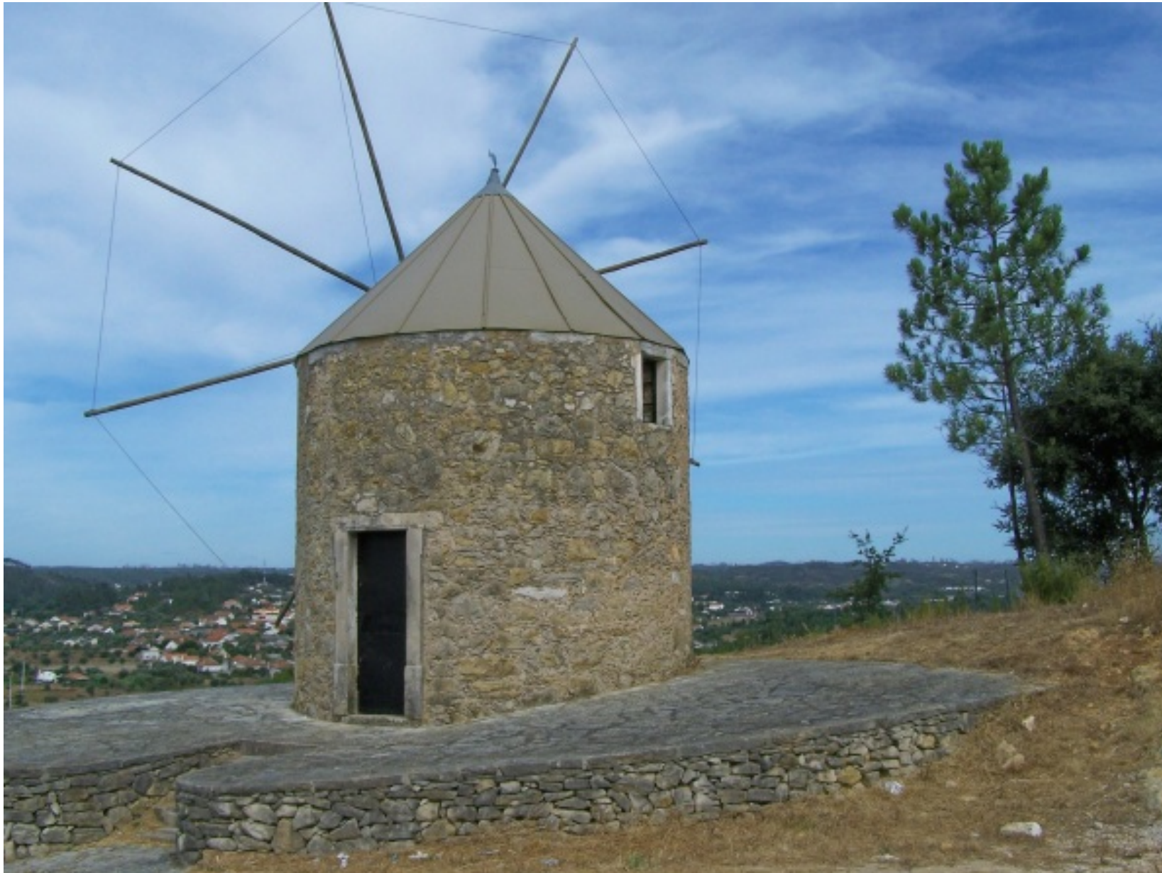
Moinho de vento da Avanteira