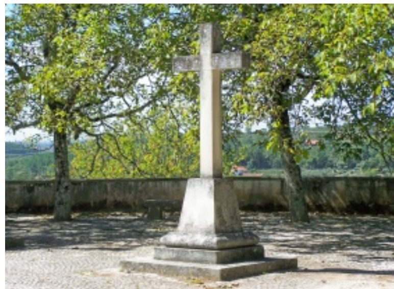
Pussos: pormenores da Igreja Matriz e espaço envolvente