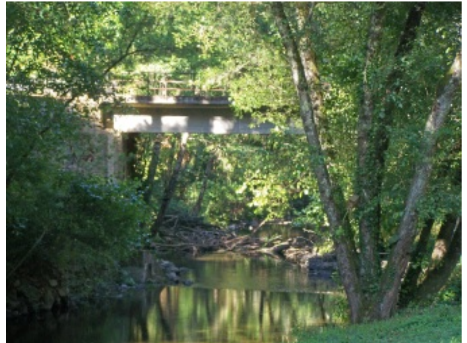
Duas vistas da praia fluvial da Ribeira d'Alge