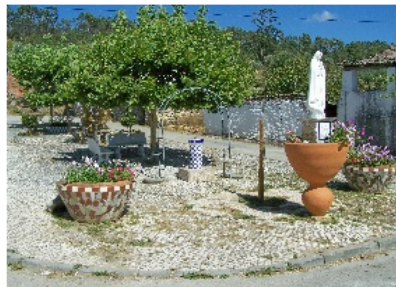
Pelmá: Aspectos da Igreja Matriz, fonte e praça central