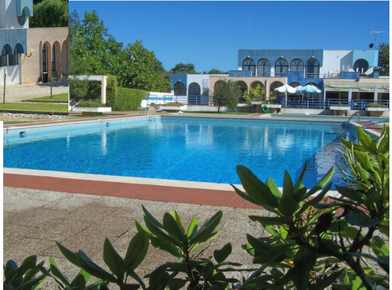
Aspectos da Piscina Municipal