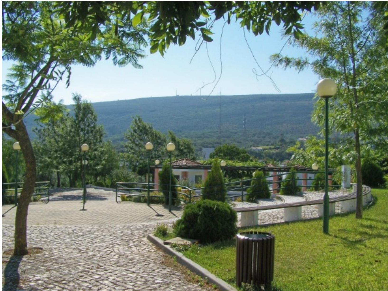
Vista do Jardim Municipal de Alvaiázere