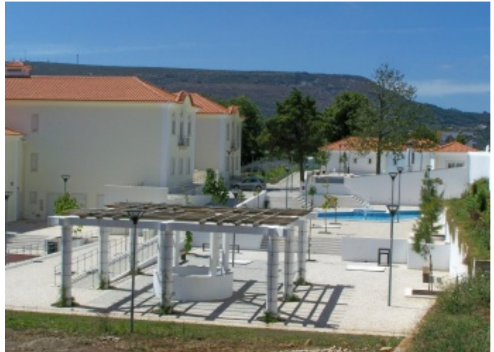
Pormenores do espaço exterior do Museu Municipal