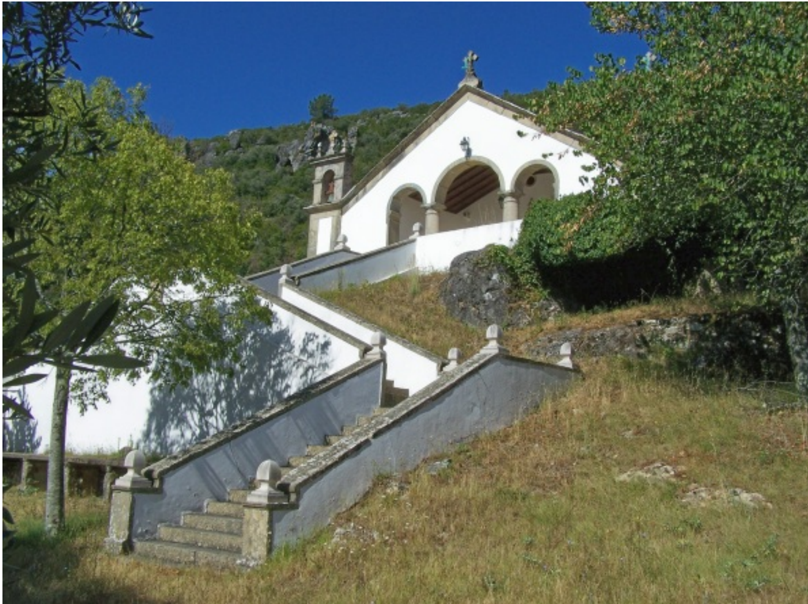
Capela dos Covões, na serra de Alvaiázere