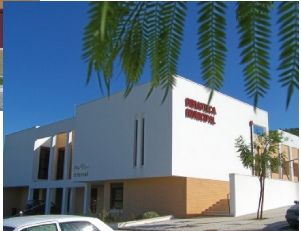
Duas perspectivas da Biblioteca Municipal de Alvaiázere