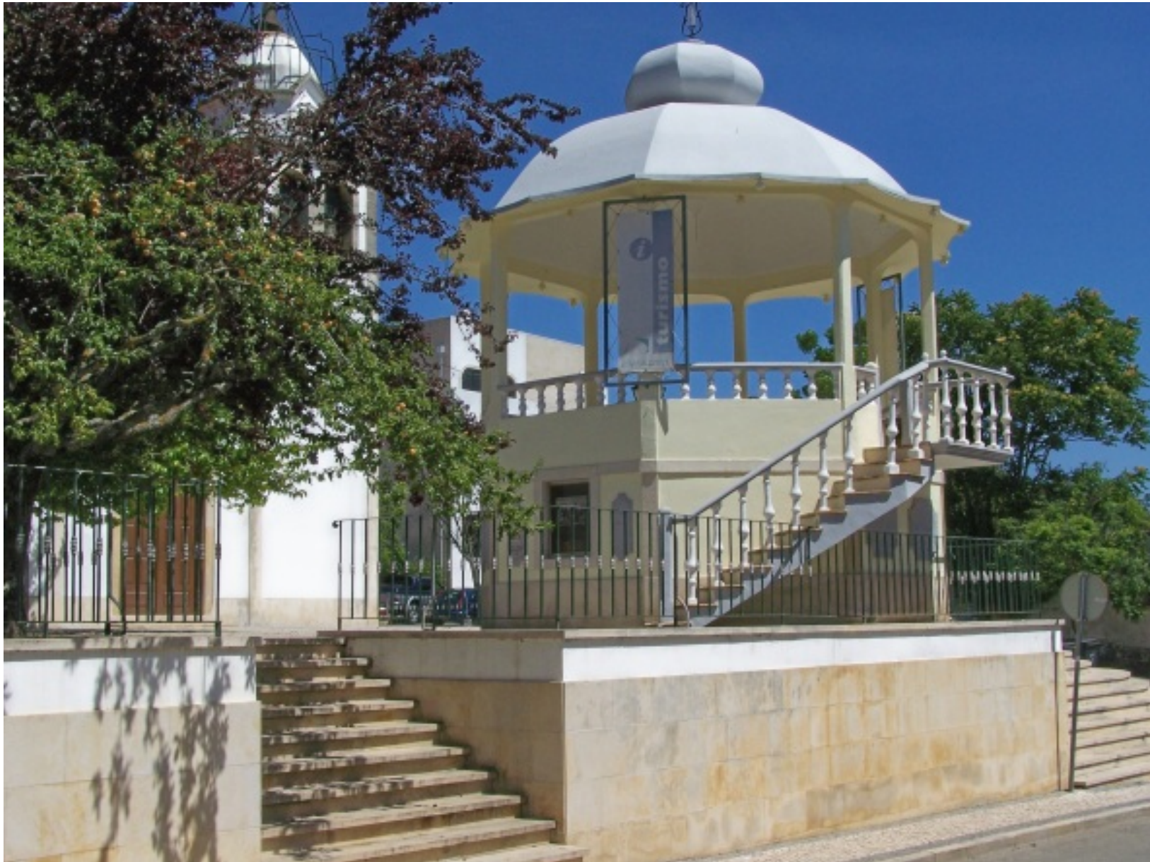
Coreto/Posto de Turismo, localizado no centro da vila