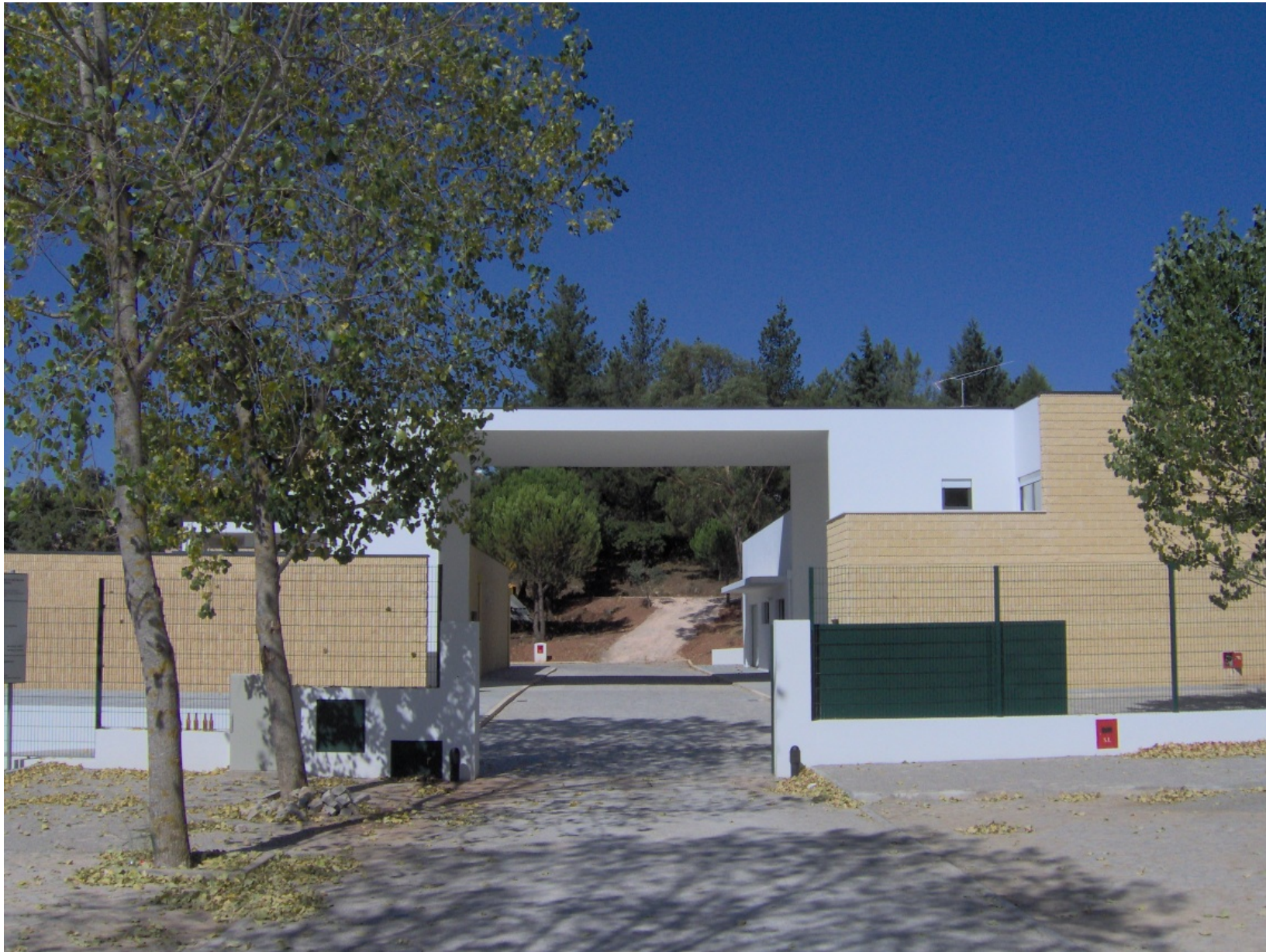
Parque de Campismo