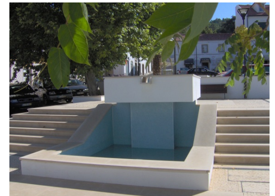
Espaço de lazer localizado nas traseiras da Igreja Matriz