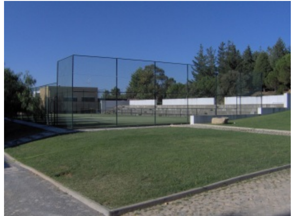
Vistas do campo de ténis, localizado na zona desportiva