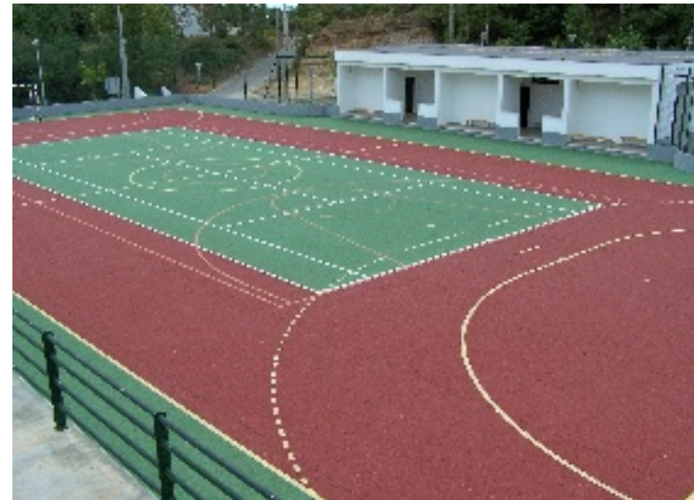
Almoester: Igreja Matriz, espaço circundante e espaço desportivo