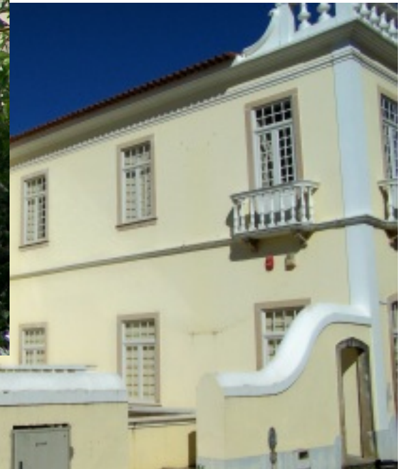
Casa Municipal da Cultura