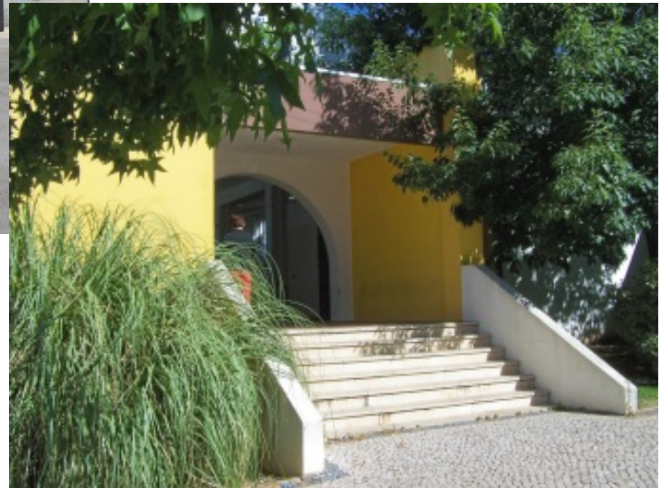
Aspectos dos espaços dedicado à realização de festas e mercados