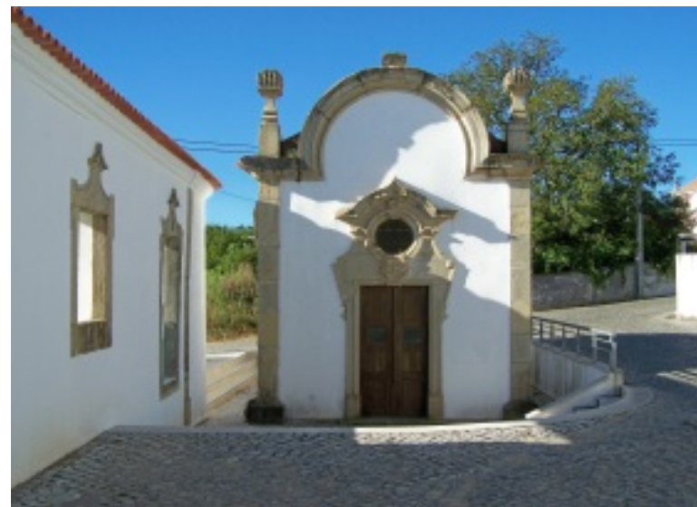
Maças de Dona Maria: Igreja Matriz, jardim, Centro Polivalente Multiusos e aspecto da Capela dos Pimentéis