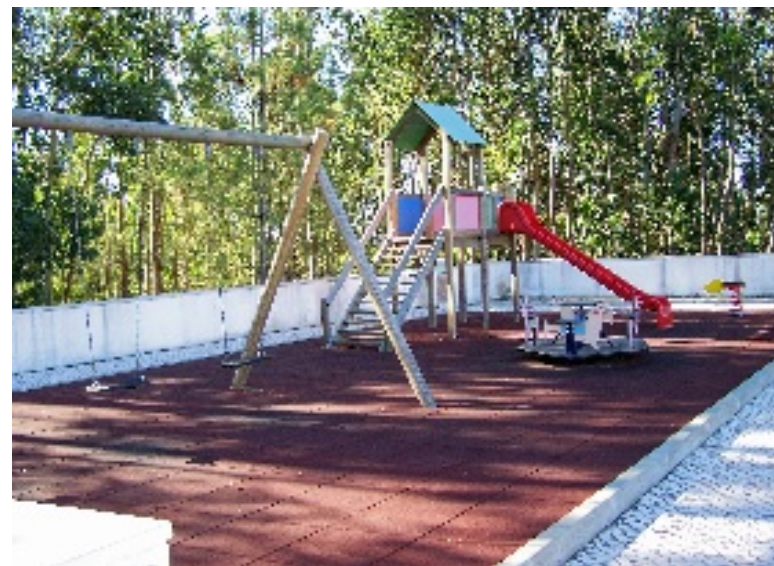
Maças de Caminho: Igreja Matriz, espaço envolvente e pormenor do Parque Lúdico