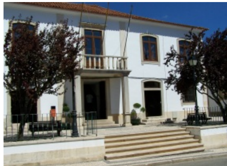
Cine-Teatro José Mendes de Carvalho, escola profissional do Sicó, escola Cesário Neves e edifício Paços do Concelho