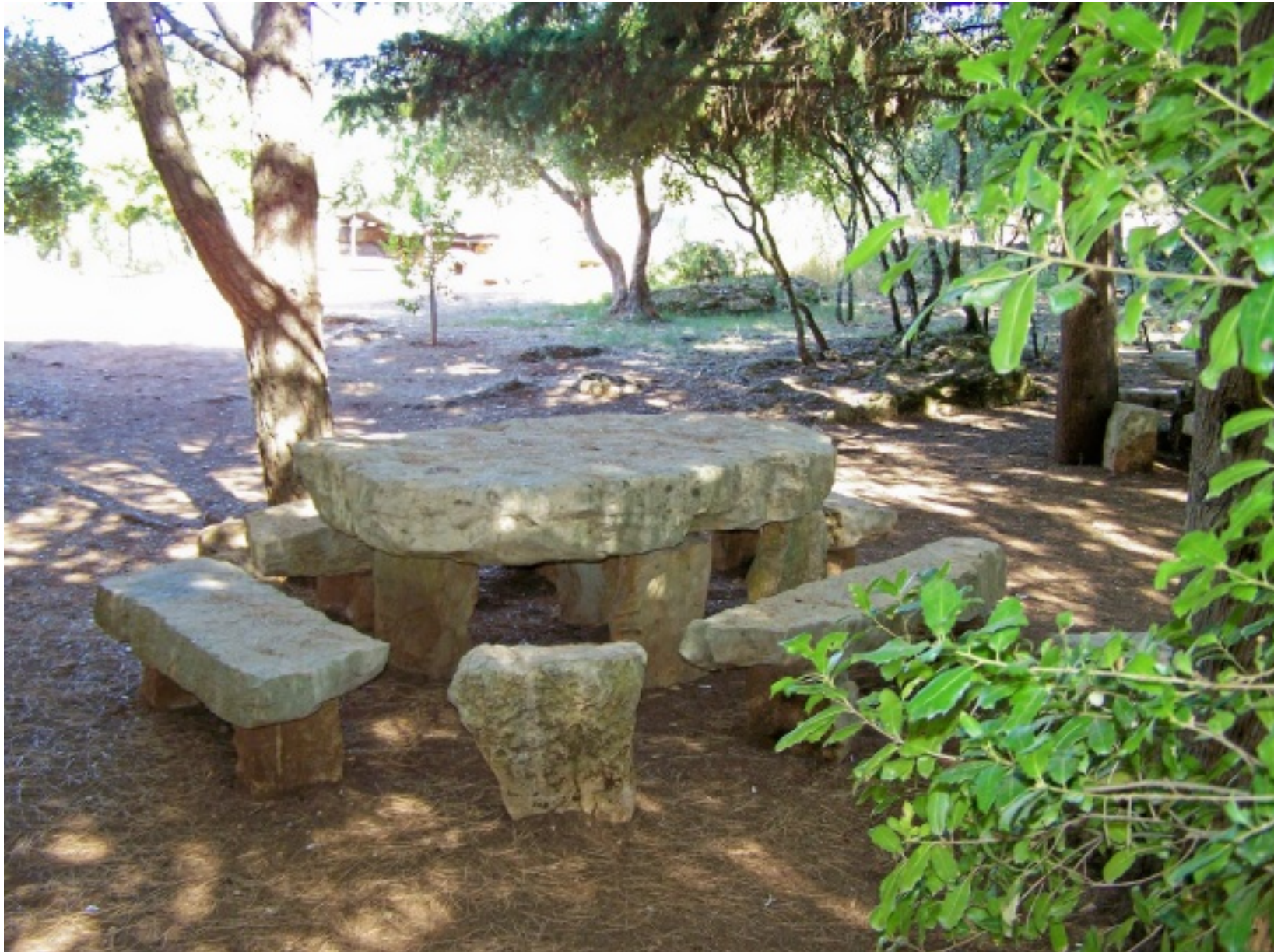
Vista da Mata do Carrascal