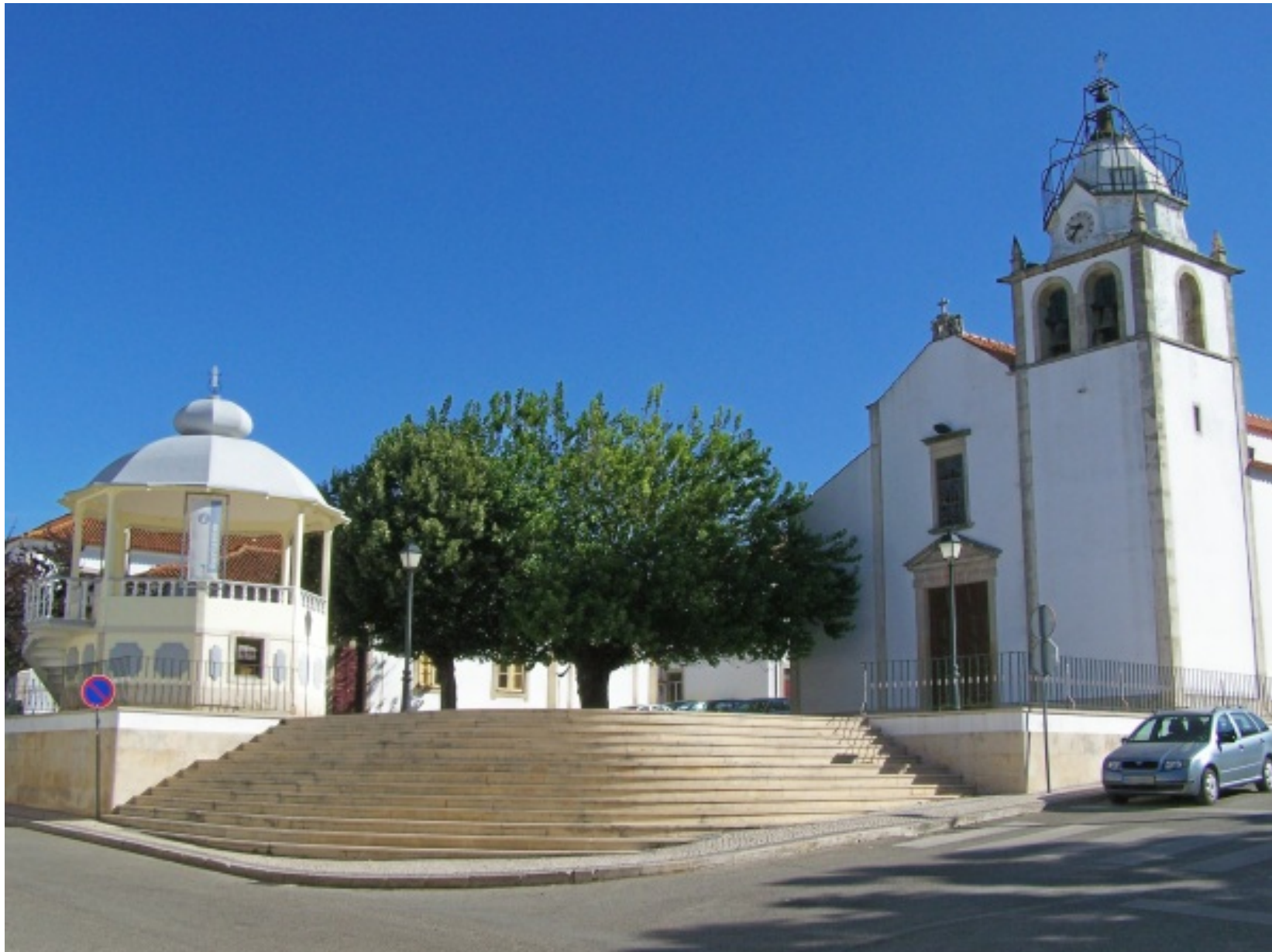
Aspecto da Igreja Matriz e espaço envolvente