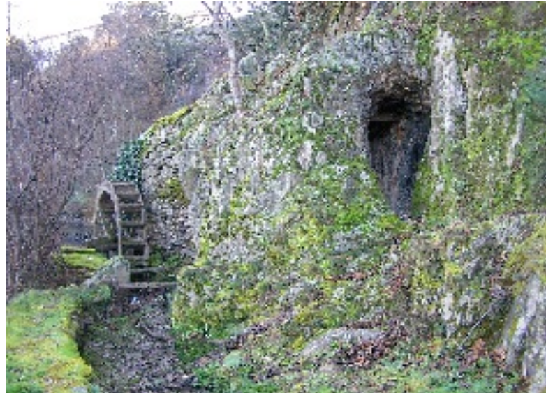
Janeiro de Baixo: parque de campismo rural, fonte em xisto e aspecto de moinho cravado na rocha