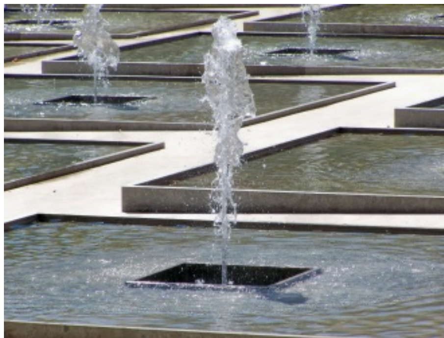
Aspectos do centro da vila