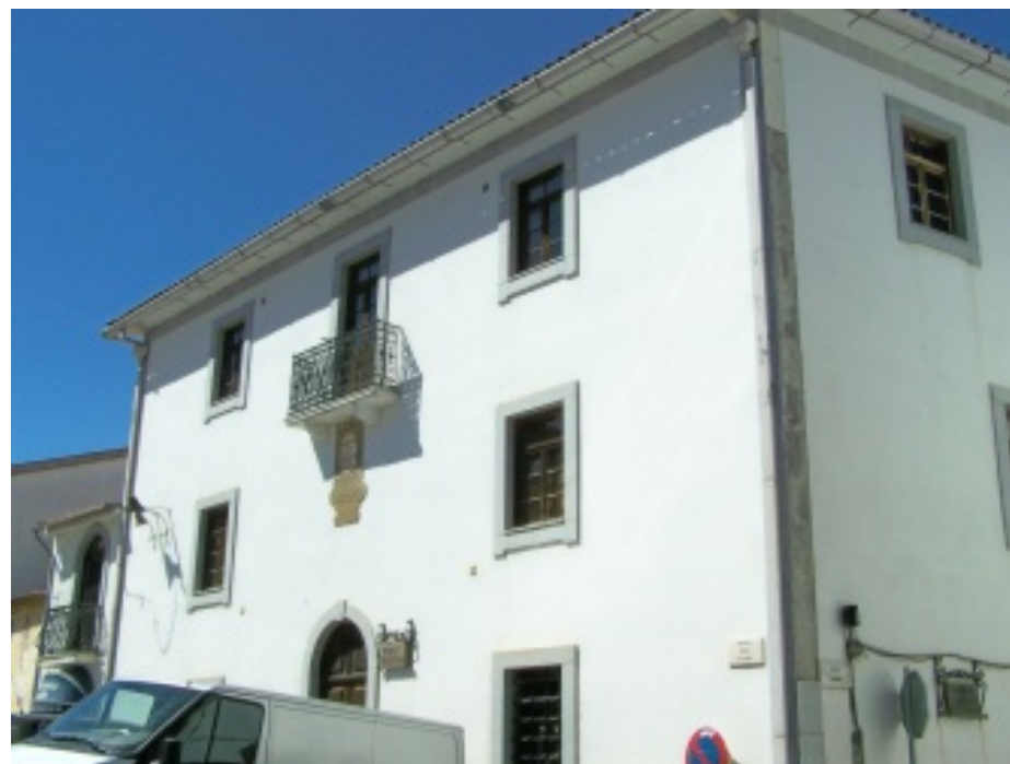
Capela da Misericórdia/fonte da praça e Museu Municipal/Posto de Informação e Turismo