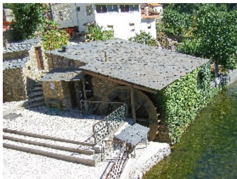
Pessegueiro: praia fluvial, parque de merendas e lagar antigo