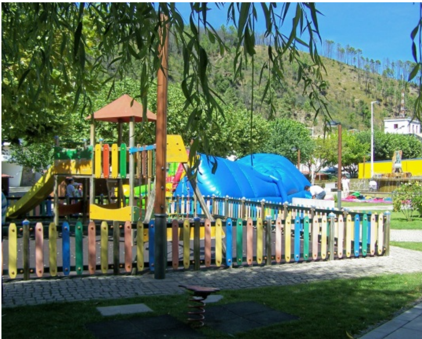
Aspecto do parque infantil situado atrás do edifício Paços do Concelho