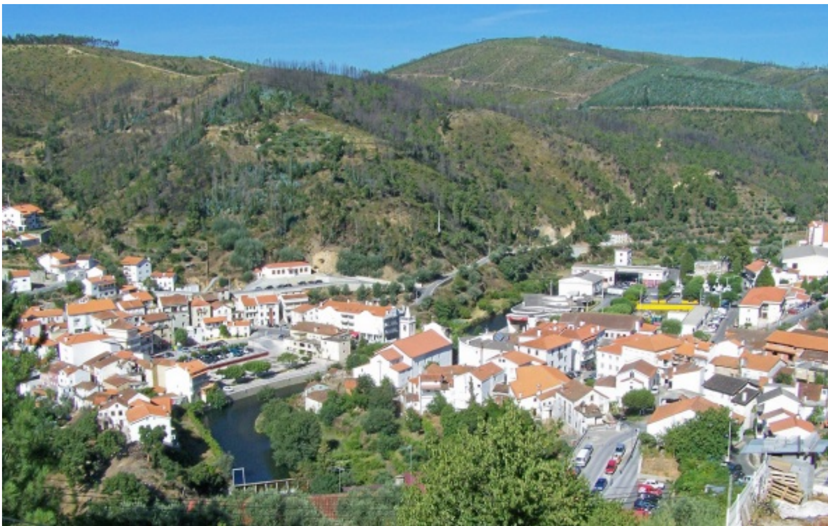
Vista da Pampilhosa da Serra