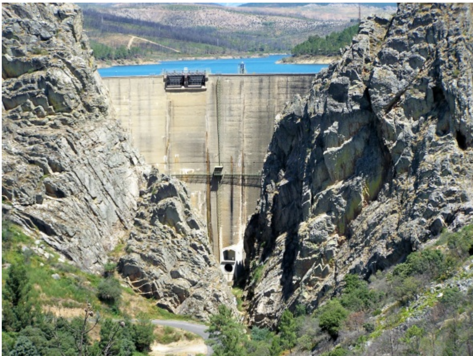
Aspecto da Barragem de Santa Luzia