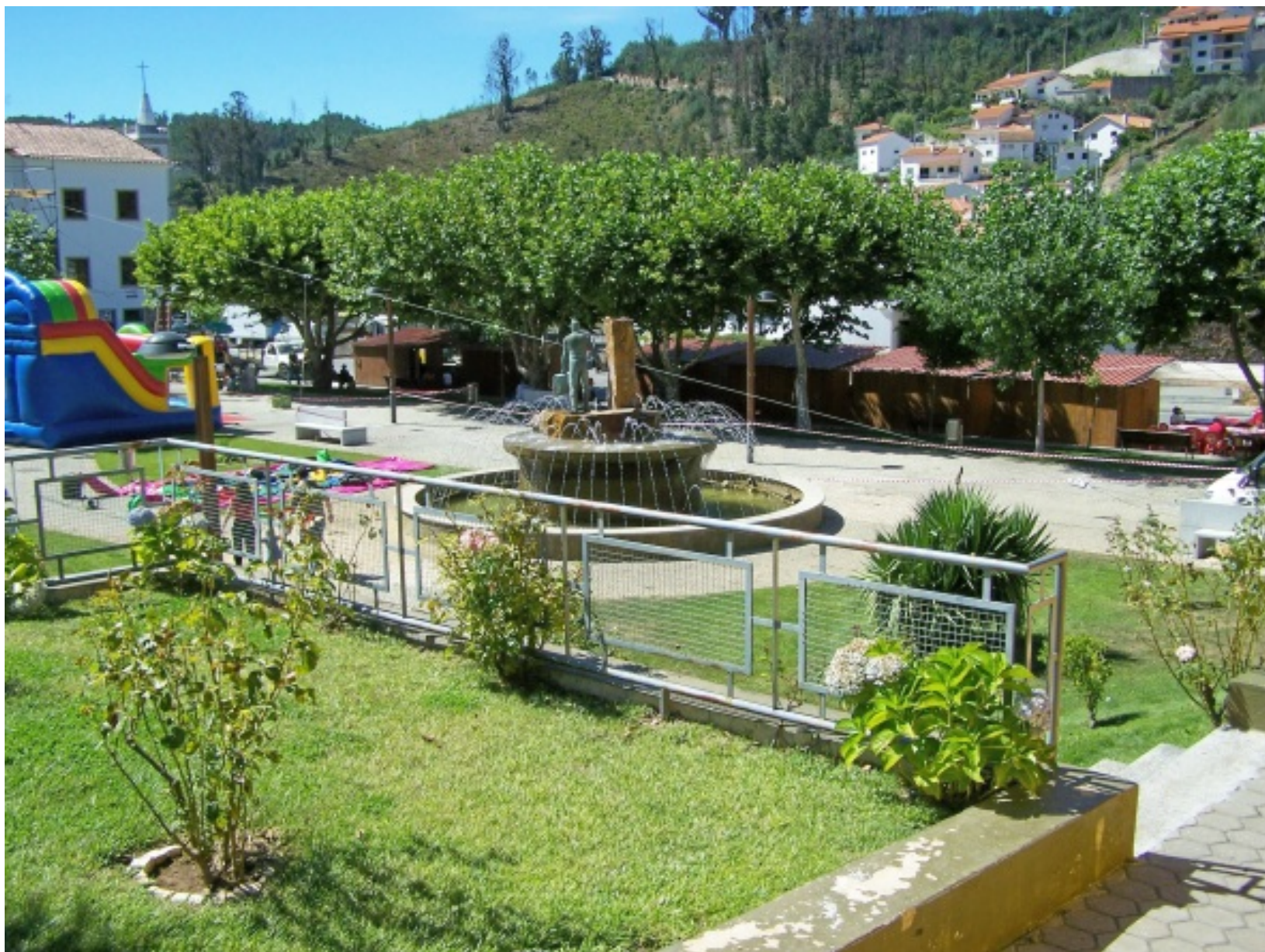
Vista da Praça do Regionalismo