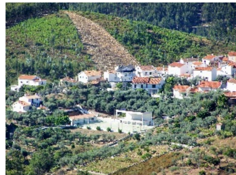
Machio (de cima e de baixo): Igreja Matriz, junta de freguesia, capela e vista parcial