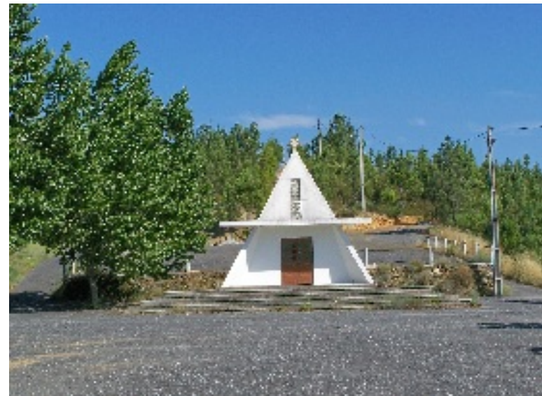
Dornelas do Zêzere: miradouros, praia fluvial e santuário