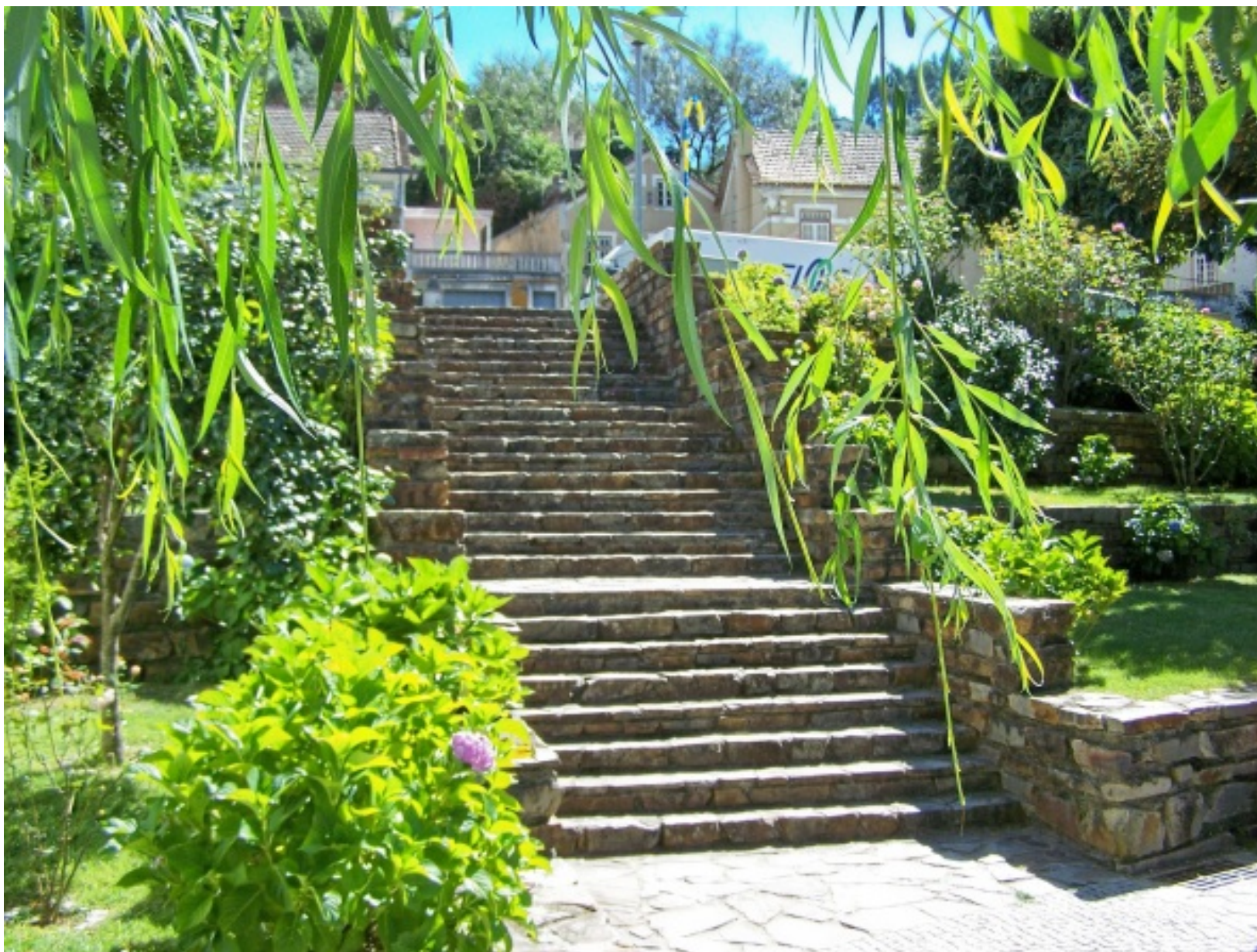
Espaço verde no centro da vila