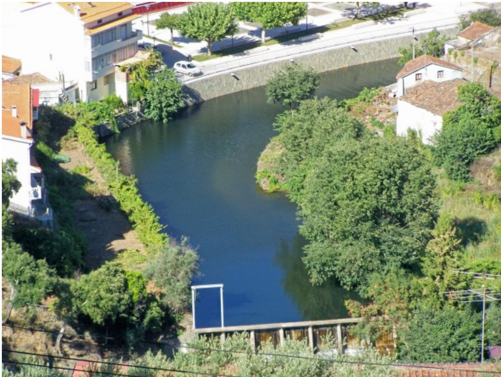
O Rio Unhais atravessa a Pampilhosa da Serra