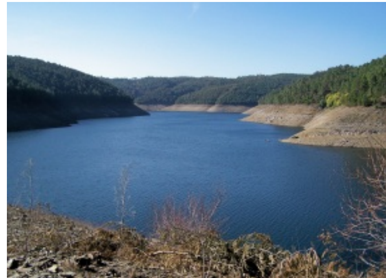
Portela do Fôjo: Igreja Matriz, barragem e espaço envolvente (Vilar) e Ilha dos Padrões