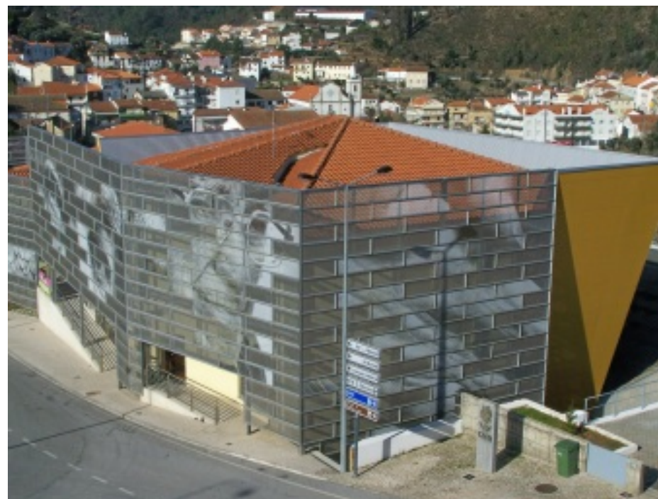
Pormenor da Piscina Municipal e aspecto do edifício Monsenhor Nunes Pereira