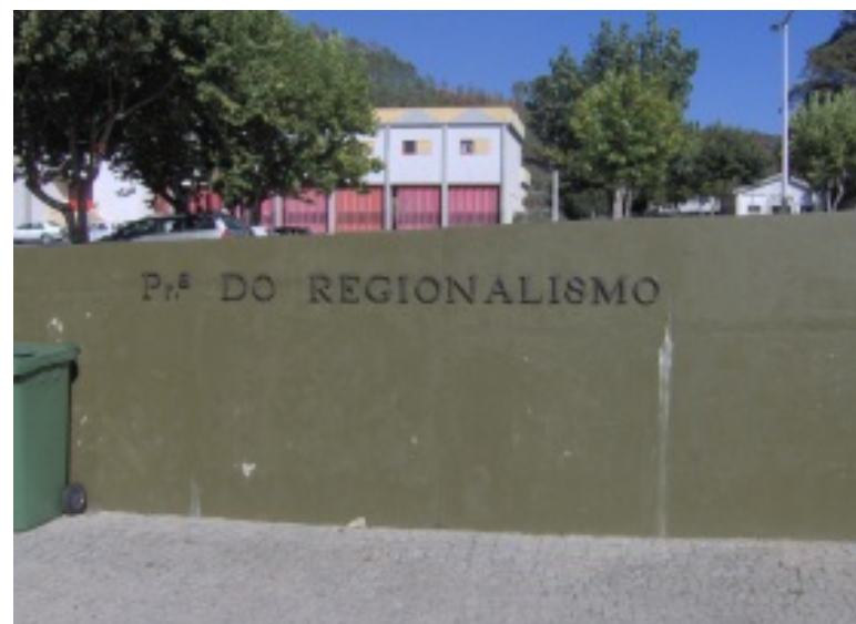
Pormenores da Praça do Regionalismo