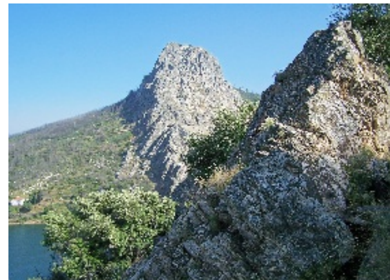
Aspectos do Vidual: Capela, Igreja Matriz, vistas sobre a barragem de Santa Luzia