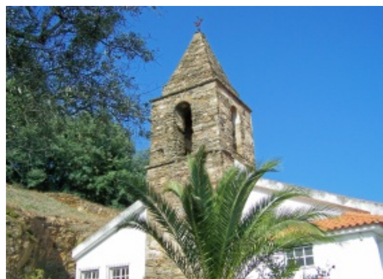
Pormenores do Cabril: Igreja Matriz, espaço envolvente, monumento e torre da Igreja antiga