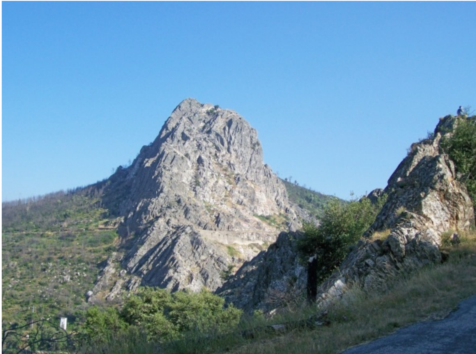
Afloramentos quartezíticos junto à barragem de Santa Luzia