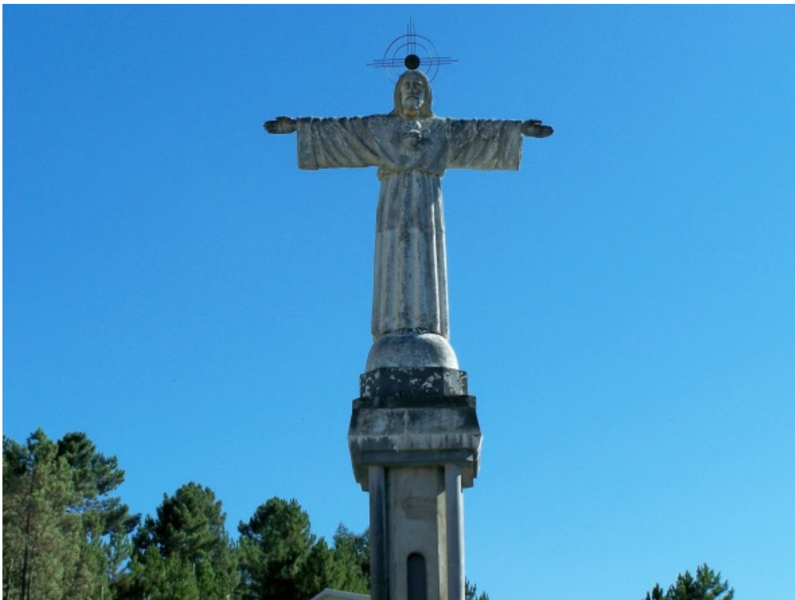
Cristo Rei, no topo da encosta (Pampilhosa da Serra)