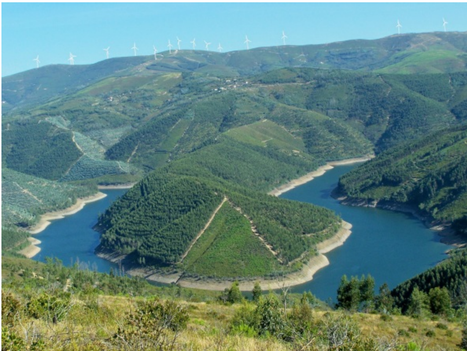
Pormenor do Rio Zêzere