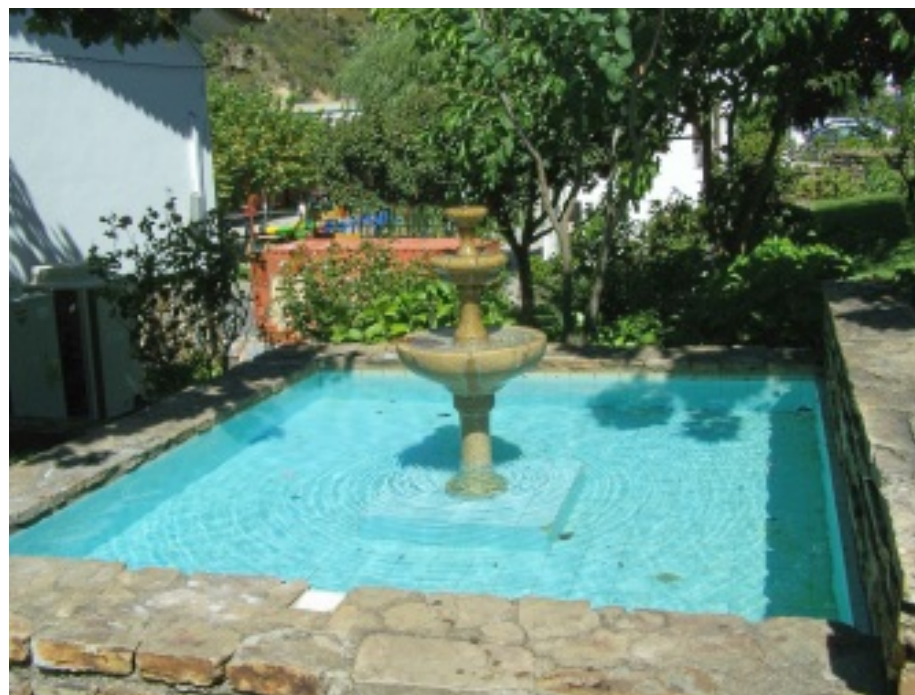
Aspectos do centro da vila