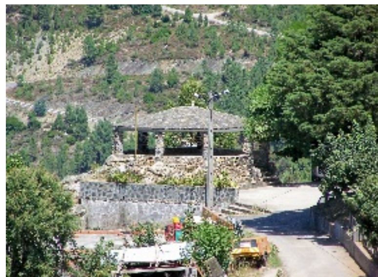
Fajão, aldeia do xisto: Casa da Moita, Casa da Cultura e pormenores de construção em xisto