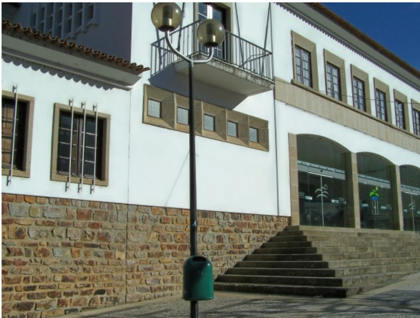
Fachada do edifício Paços do Concelho