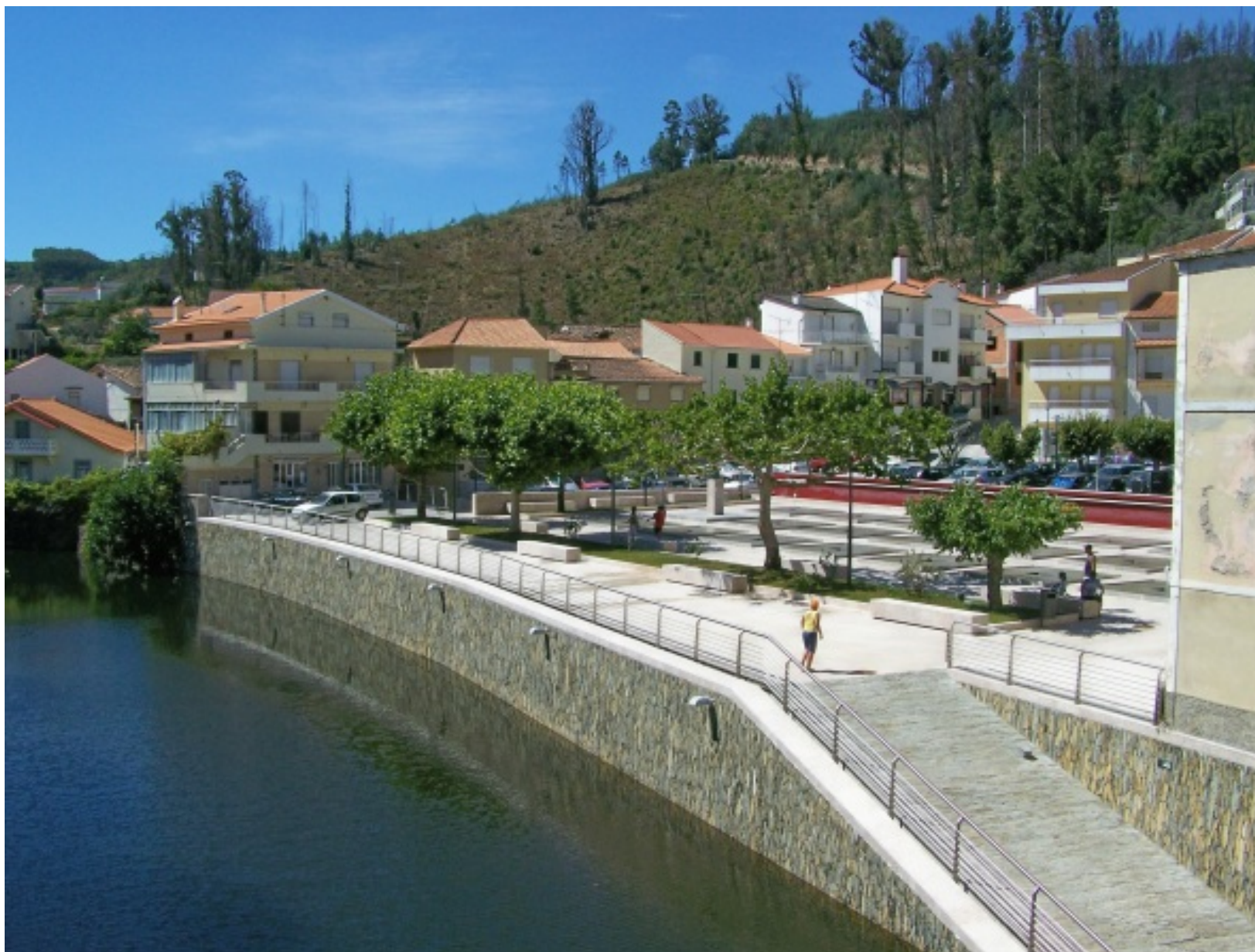
Rio Unhais e Praça José Henriques da Cunha