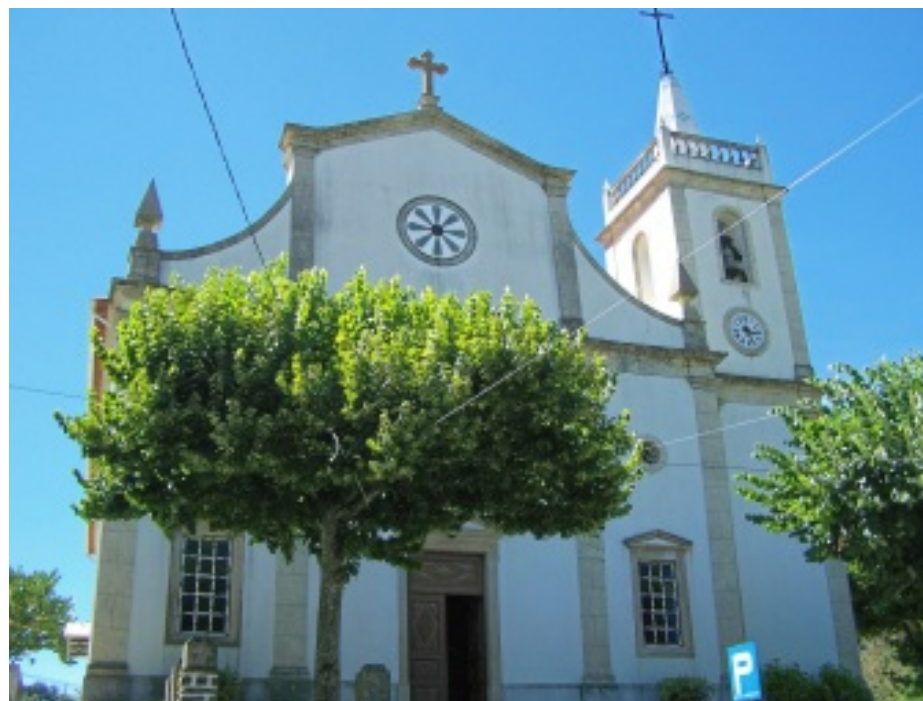
Vistas da Igreja Matriz da Pampilhosa da Serra