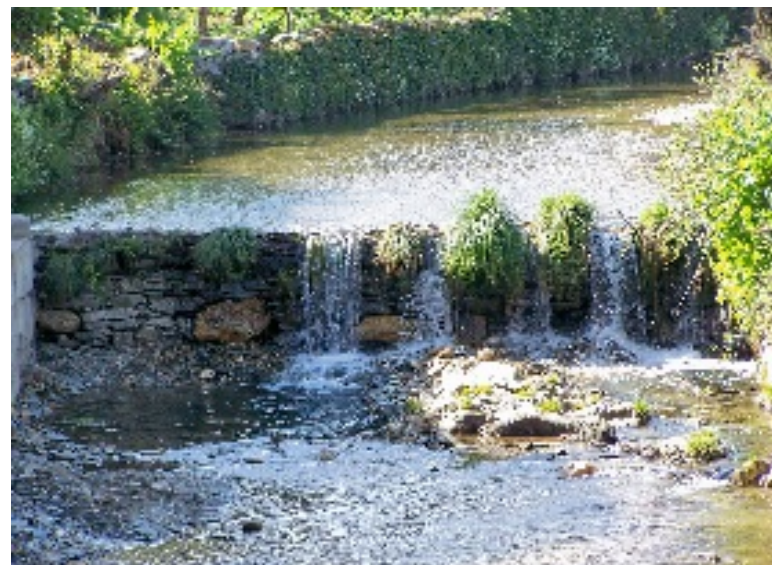
Unhais-o-Velho: vista parcial, Capela sextavada e pormenores da praia fluvial e ponte