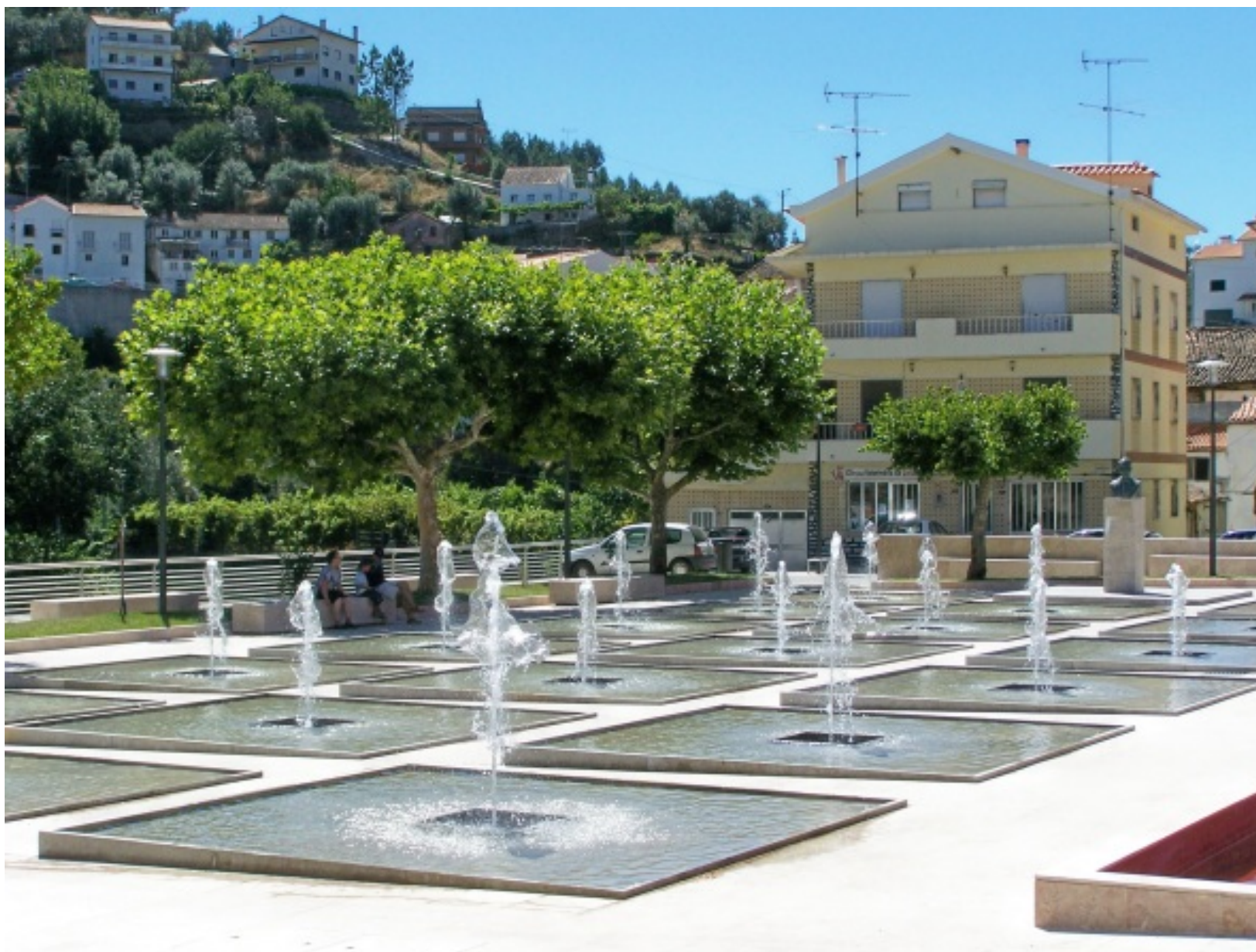
Praça José Henriques da Cunha